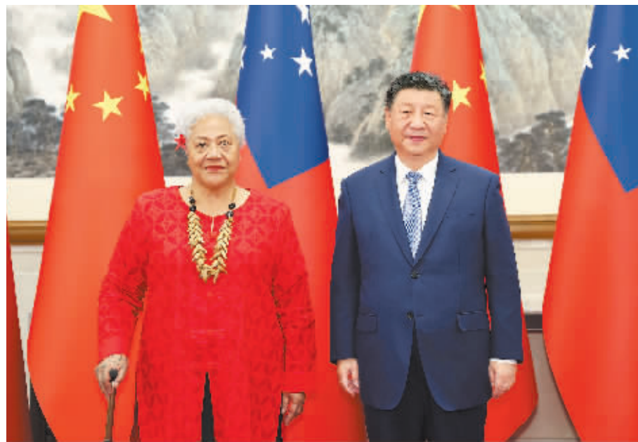
11 月 26 日下午,国家主席习近平在北京钓鱼台国宾馆会见来华进行正式访问的萨摩亚总理菲娅梅。

习近平强调,中国对太平洋岛国秉持“四个充分尊重”原则,对太平洋岛国的帮助不附加政治条件,不强加于人,不开“空头支票”。中国对太平洋岛国的政策开放包容,没有私心,不针对第三方,不搞地缘争夺和势力范围。中方愿将帮助太平洋岛国提升应对气候变化能