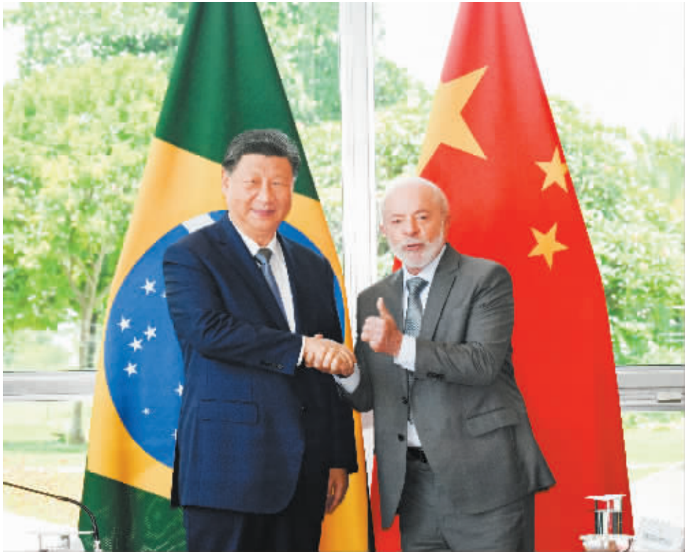
当地时间 11 月 20 日上午,国家主席习近平在巴西利亚总统官邸黎明宫同巴西总统卢拉举行会谈。