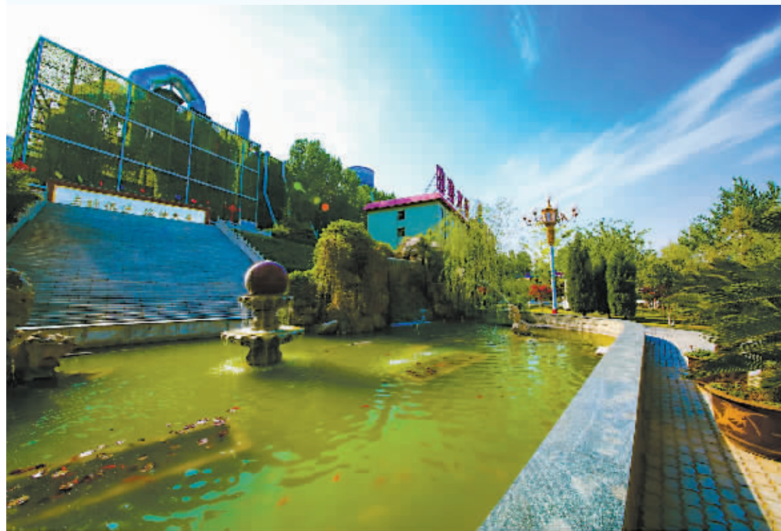
石家庄市曲寨水泥有限公司树立绿色发展理念,打造花园式绿色工厂。

堆积如山的建筑垃圾、装修换下来的旧沙发、物品包装袋……看似无用的废弃物,置于另一个循环中就是有用的资源。