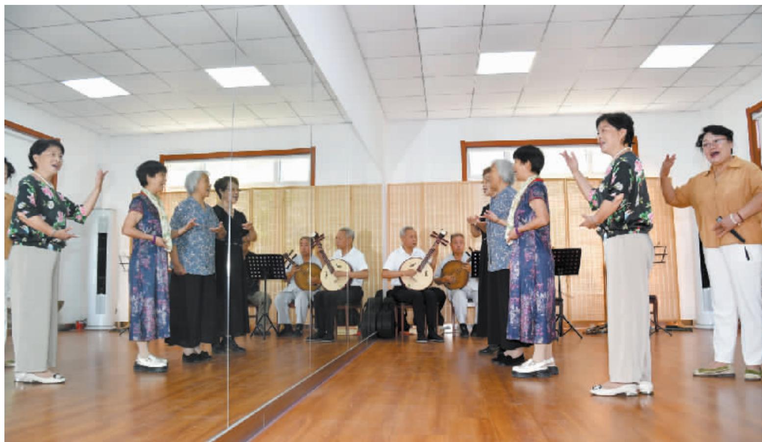
在新华区宁安街道日间照料中心,老人们在排练戏曲节目。