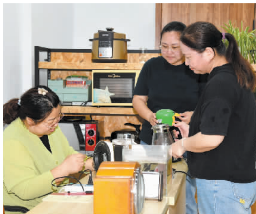
在明珠花苑社区党群服务中心“暖心驿站”,志愿者为居民维修家电。