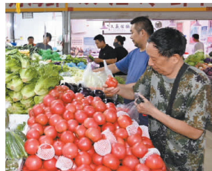
市民在桥西区东里便民市场选购新鲜蔬菜。