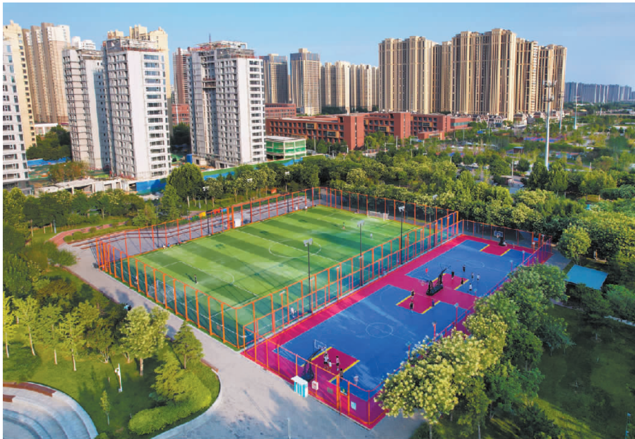
初秋时节,市民在家门口的体育公园运动健身。