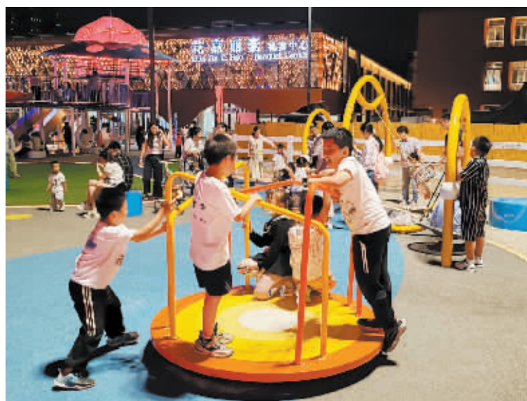
傍晚时分,孩子们在石美集城市微度假中心儿童乐园玩耍。