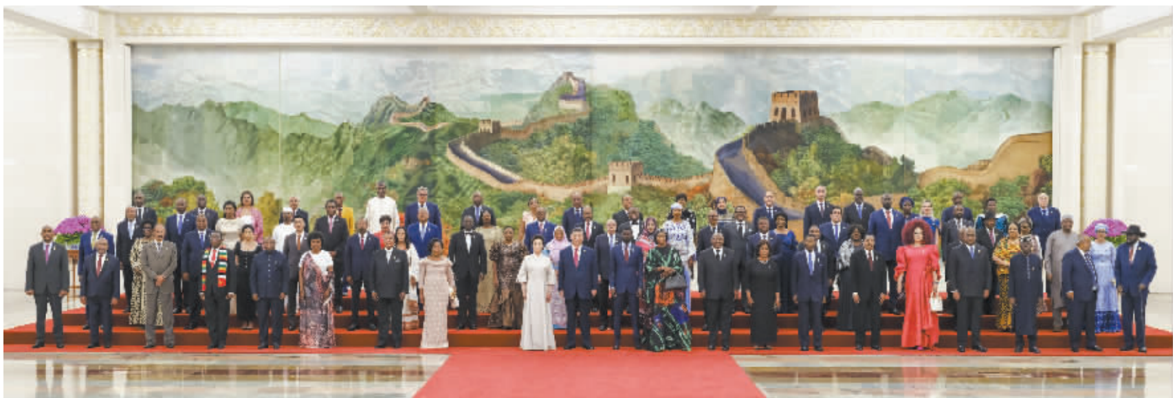
9月4日晚，国家主席习近平和夫人彭丽媛在北京人民大会堂举行宴会，欢迎来华出席中非合作论坛北京峰会的非方及国际贵宾。这是宴会前，习近平和彭丽媛同贵宾们集体合影留念。