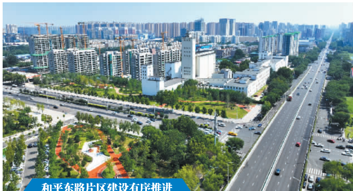
和平东路片区建设有序推进

8月29日,石家庄市和平东路片区各项工程正在加快建设。该片区是我市“6+2+2”城市更新项目的重点项目之一,将重点完善公共配套服务,延续历史文化遗产,促进工业遗产与文化旅游深度融合,展现城市底蕴、释放城市活力。