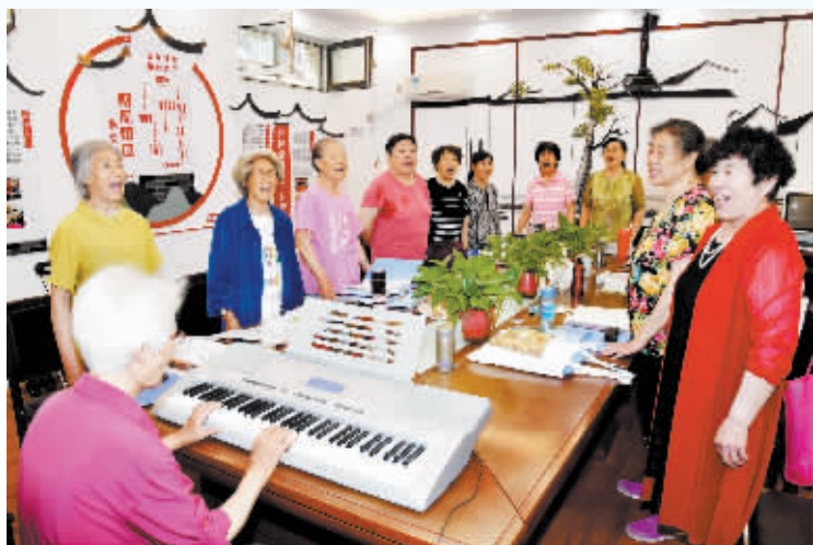
在石家庄市新华区盛世天骄社区日间照料站,老人们正在排练合唱。