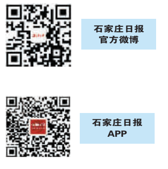
石家庄日报官方微博