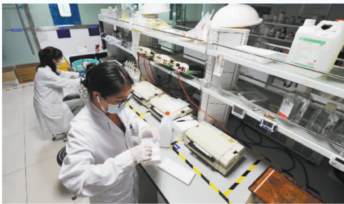
以岭药业研发人员正在进行新药研发实验。