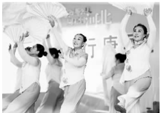
图为演员们为村民表演歌舞节目。

台上演出精彩纷呈,台下观众掌声阵阵。村民纷纷表示,“在家门口看到这么精彩的演出,不仅给生活增添了乐趣,也让村里更加热闹了,感觉很满足,很快乐!”