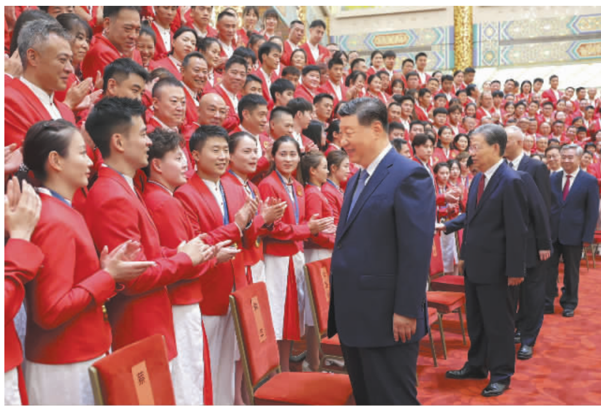
8月20日，党和国家领导人习近平、赵乐际、王沪宁、蔡奇、李希、韩正等在人民大会堂接见第33届夏季奥林匹克运动会中国体育代表团全体成员。

新华社北京8月20日电 中共中央总书记、国家主席、中央军委主席习近平20日下午在人民大会堂接见第33届夏季奥林匹克运动会中国体育代表团全体成员。他强调，在巴黎奥运会上，你们团结一心、顽强拼搏，奋勇争先、不负使命，取得我国参加夏季奥运会境外参赛历史最好成绩，实现了比赛成绩和精神文明双丰收，为祖国和人民赢得了荣誉。他代表党中央和国务院欢迎大家凯旋，向大家致以热烈祝贺和诚挚慰问，并向全国体育战线的同志们表示亲切问候。中共中央政治局常委赵乐际、王沪宁、蔡奇、李希、国家副主席韩正参加接见。