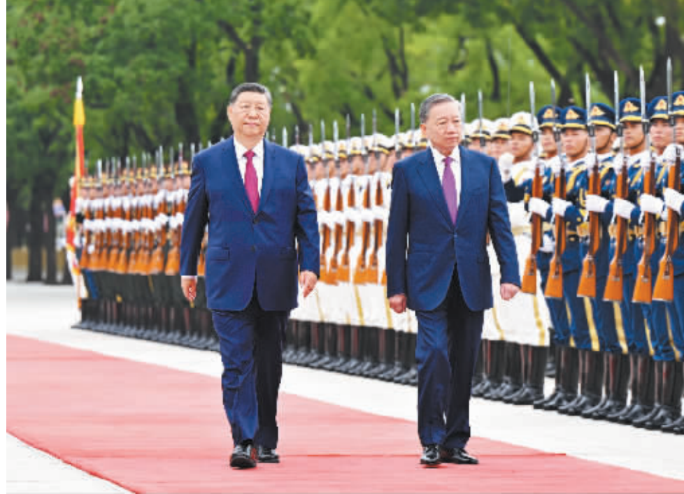
八月十九日,中共中央总书记、国家主席习近平在北京人民大会堂同来华进行国事访问的越共中央总书记、国家主席苏林举行会谈。这是会谈前,习近平在人民大会堂东门外广场为苏林举行欢迎仪式。

苏林表示,我作为越共中央总书记、国家主席首次出访来到中国,充分体现了越南党和政府一贯重视发展对华关系的立场,将中国作为越南对外政策的战略选择和头等优先。越南党和政府将继续继承富仲同志遗志,坚持共产党领导,坚持社会主义道路,坚定沿着两国老一辈领导人特别是阮富仲总书记和习近平总书记共同确定的道路前进,按照“六个更”总体目标,深化越中全面战略合作伙伴关系,推进构建具有战略意义的越中命运共同体。在以习近平同志为核心的党中央领导下,中国胜利完成中共十八届三中全会确定的所有改革任务,取得巨大发展成就,国际地位和影响力日益提升,为世界和平与发展以及全人类进步作出重要贡献。越方将学习借鉴中共二十届三中全会成功召开,开启了进一步全面深化改革、推进中国式现代化的新纪元。相信在习近平总书记领导下,中国必将胜利实现第二个百年奋斗目标,全面建成社会主义现代化强国。越方坚持独立自主,坚定奉行一个中国政策,认为台湾是中国领土不可分割的一部分,坚决反对一切形式的“台独”分裂活动,坚定支持中国实现国家统一。香港、新疆、西藏都是中国内部事务,越方坚决反对任何势力干涉中国内政。 (下转第三版)