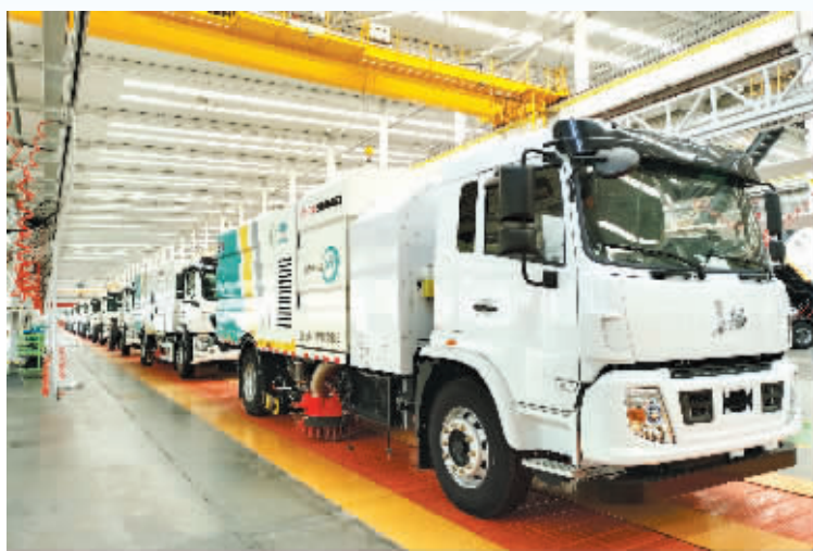
图为石煤机公司自主研发的新能源环卫车。

国内首台防爆锂电池齿轨车在石煤机下线,自主研发的18吨氢燃料电池清洗车成功下线,新型防爆锂电池单轨吊获市场“通行证”……石家庄煤矿机械有限责任公司的新技术、新产品似乎“层出不穷”,频频见诸媒体。为什么会这样?有什么“神秘”力量作支撑?日前,记者走进该企业一探究竟。