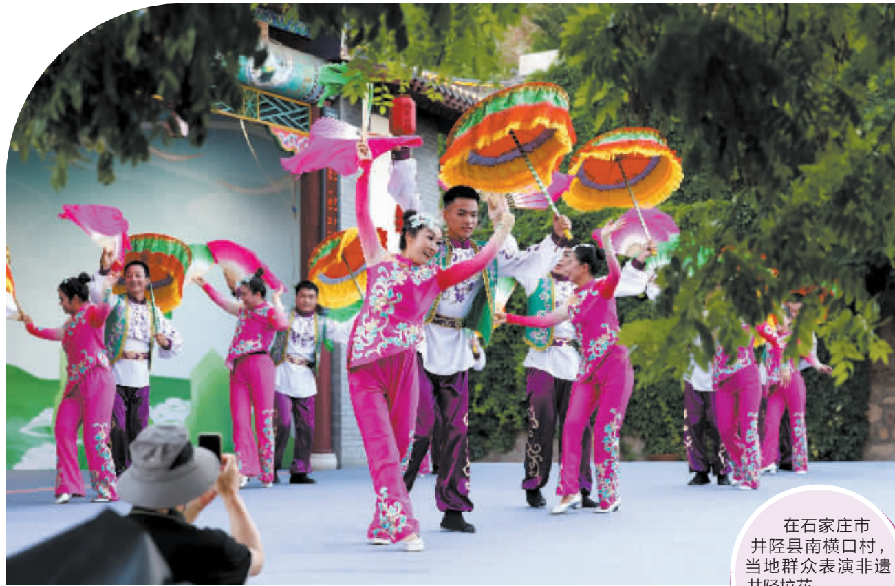
在石家庄市井陘县南横口村，当地群众表演非遗井陘拉花。

井陘拉花最早源于民间节日、庙会时的街头广场花会，是一种不受场地限制的群舞表演形式，既可街头、院场演出，也可