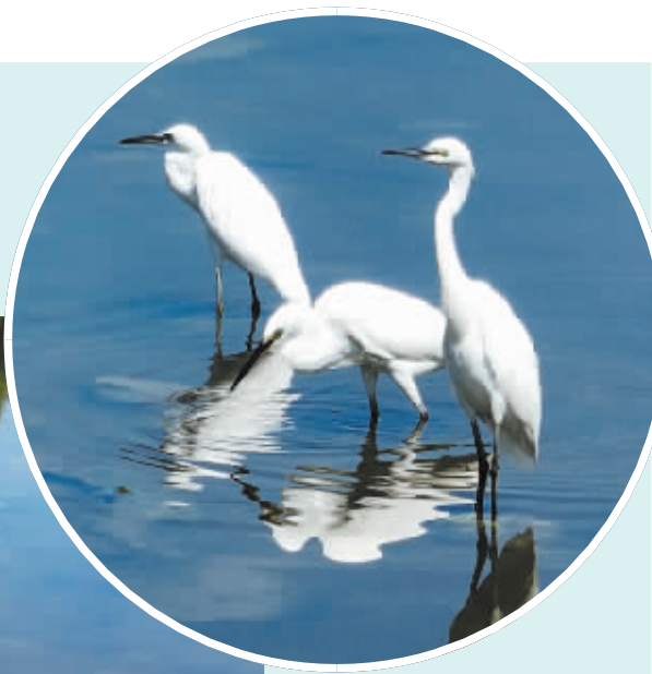
▲白鹭在水中栖息。 ▲白鹭灵动的身姿与水面构成一幅美丽自然的生态画卷。

本报(记者 杜倩倩 通讯员 翟磊 胡跃鹏)8月12日，记者在鹿泉区太平河流域东段发现，成群的白鹭聚集在一起，展翅飞翔，翩跹起舞，为当地增添了一道灵动亮丽的风景。