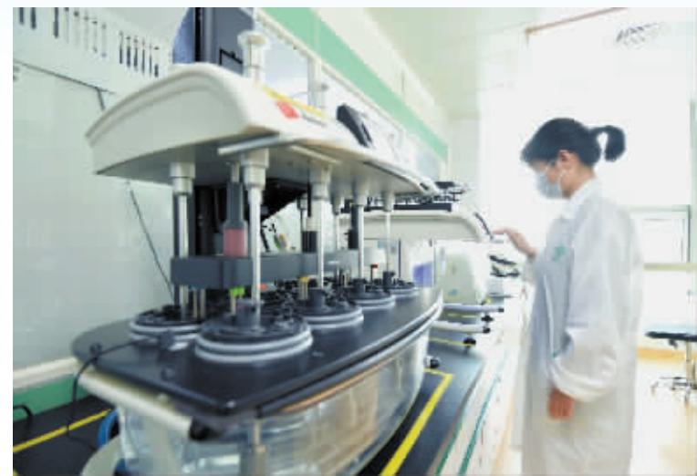
图为在神威药业国家认定企业技术中心,工作人员正在进行中药新产品的研发。