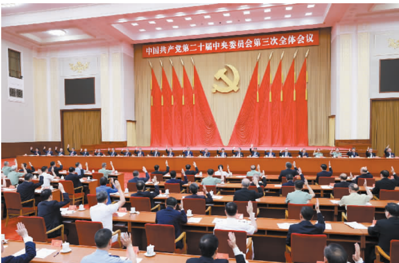
中国共产党第二十届中央委员会第三次全体会议,于2024年7月15日至18日在北京举行。中央政治局主持会议。