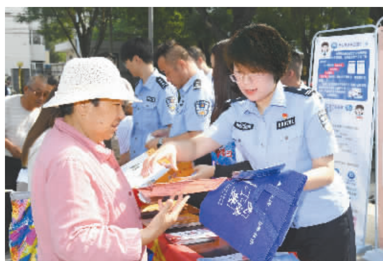
我市政法队伍坚持深入基层开展普法宣传活动,解民忧、促和谐,维护群众合法权益。图为石家庄市公安局新华分局的民警在水上公园为群众答疑解惑。

依法行政,推动有效市场和有为政府紧密结合。“码上服务,助力发展!”今年6月起,“下转第二版”