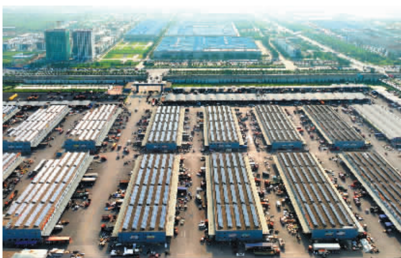
图为近日拍摄的栾城区润丰现代物流园,到处都是繁忙的景象。

近两年来,石家庄的发展明显加快,主导产业和特色产业进入黄金期,营商环境、生态环境显著跃升。特别是城市更新工作中,我市坚持“拥河发展”,在二环内做减法、二环外做乘法,还空间于城市,还绿地于人民、还公共配套服务于社会, (下转第二版)