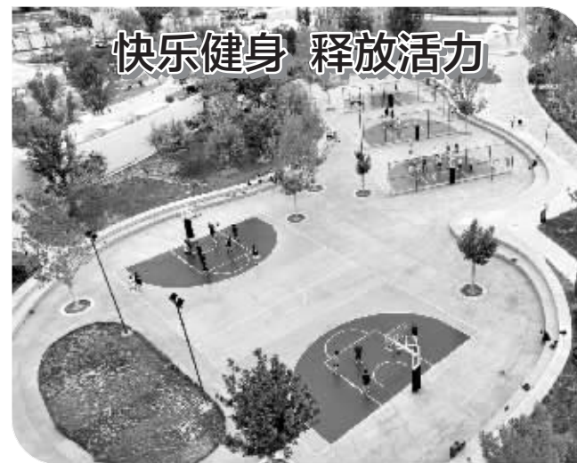
快乐健身 释放活力

近年来,石家庄持续开展非遗进景区,以丰富游客体验为中心,在景区内植入非遗展示、展演、体验活动,每年组织开展非遗进景区活动百余场,打造“非遗+旅游”场景,为广大游客提供沉浸式非遗体验。