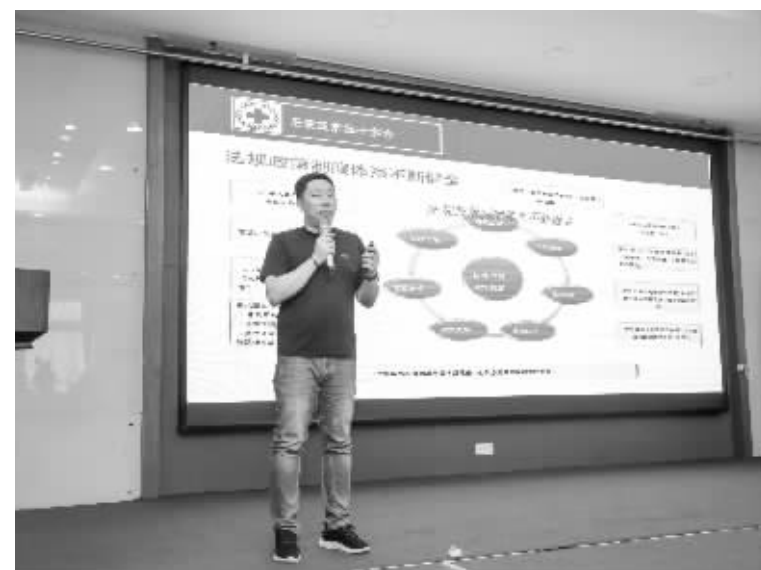
组织器官捐献业务工作培训。