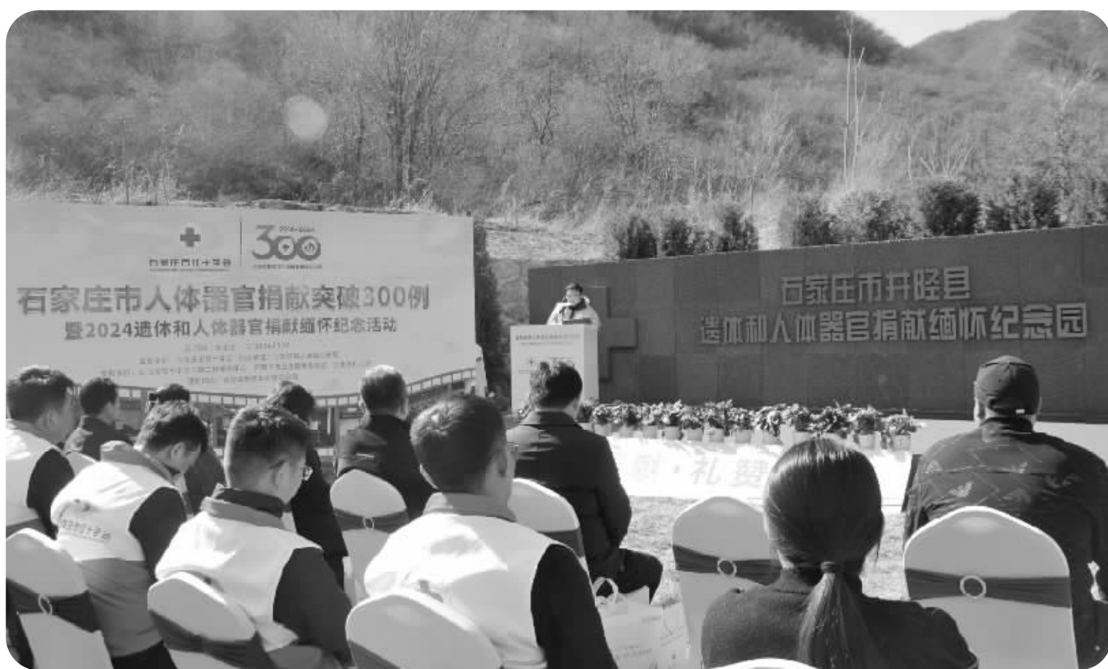
石家庄市红十字会人体器官捐献突破300例暨2024遗体捐献和人体器官捐献缅怀纪念活动现场。

为成员,明确工作内容、细化工作责任,保证了器官捐献工作大事大抓,同时,在各县(市、区)设立了具体负责人和联系人,形成了统一领导、分工明确、密切配合的良好局面。