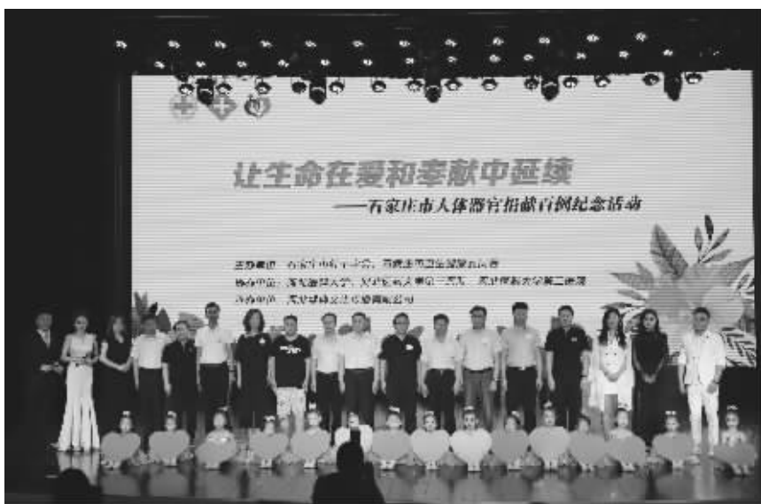
石家庄市人体器官捐献百例纪念活动。