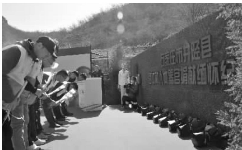
红十字志愿者在纪念碑前向遗体器官捐献者敬献鲜花。

启动人体器官捐献工作初期,石家庄市红十字会成立了专门的工作领导小组,单位主要负责同志抓协调推进,明确一名副会长主管负责,业务工作部一名专职人员具体负责,相关科室负责人和相关医疗单位人员