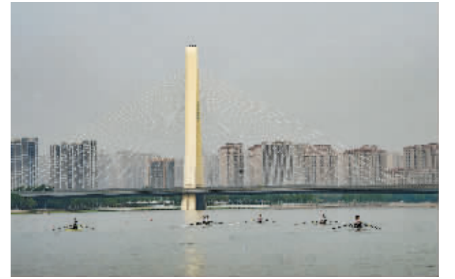
太平河上,赛艇乘风破浪,奋勇争先。