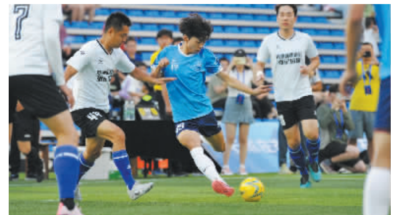
第二届中国·石家庄五人制足球全国擂台赛上,参赛球队正在进行激烈的拼抢。