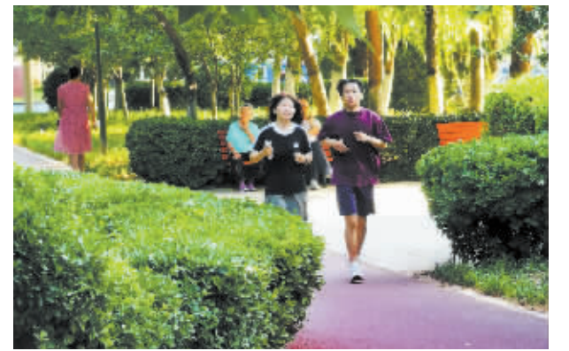
清晨,市民在民心河健身步道上锻炼,尽享运动的快乐。