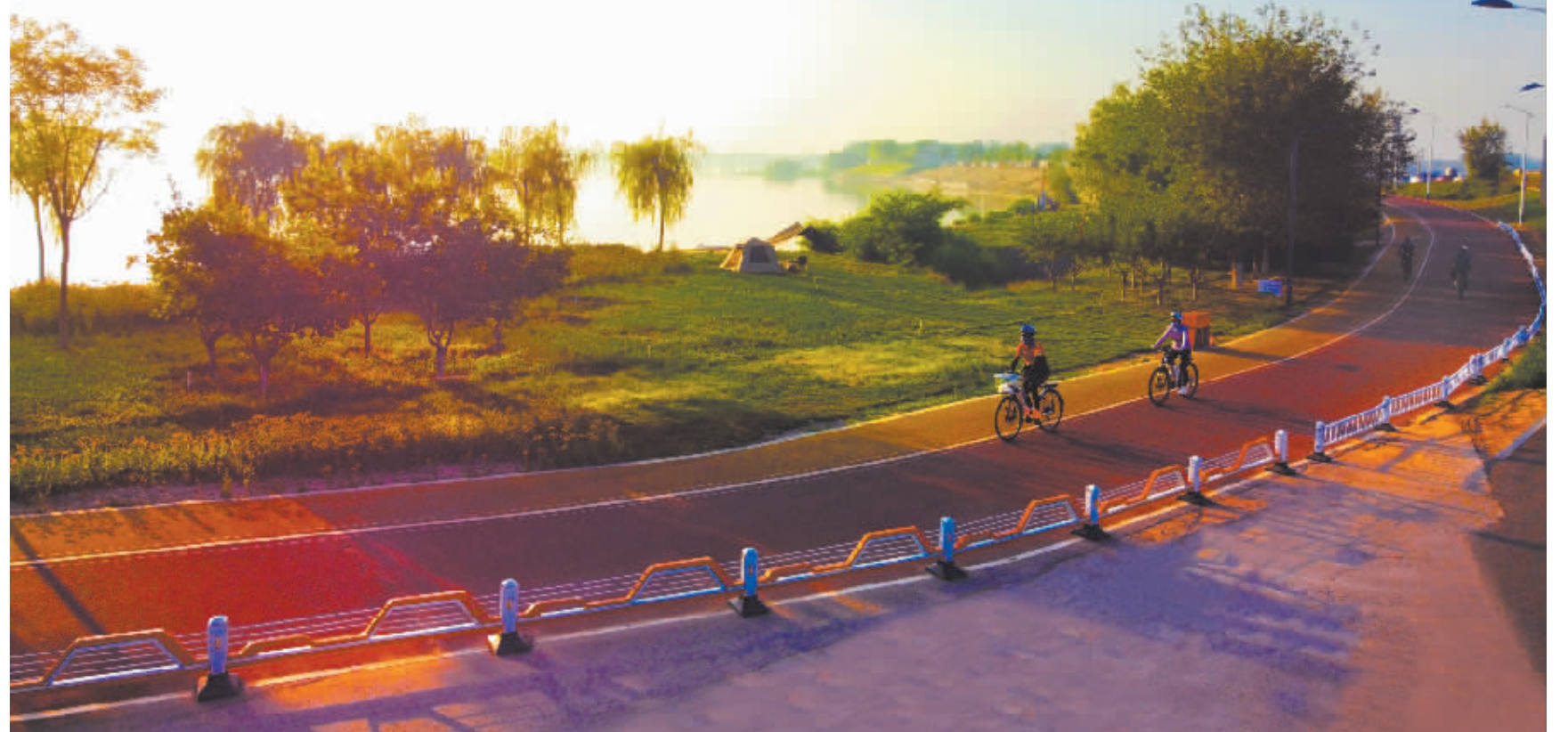
在石家庄环城绿道滹沱河段,市民迎着美丽的朝霞,在花海树林中骑行。闲暇时光健身骑行已经成为石家庄市民的新时尚。