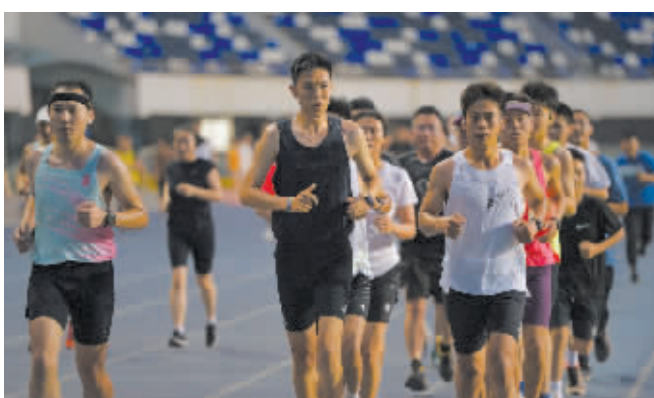
在裕彤体育中心,许多市民在这里挥汗如雨夜跑健身。