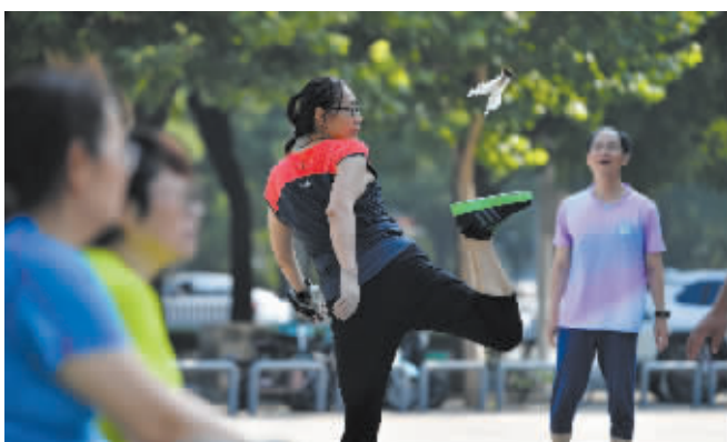
在拾光智慧体育公园,晨练的市民一起踢毽子。