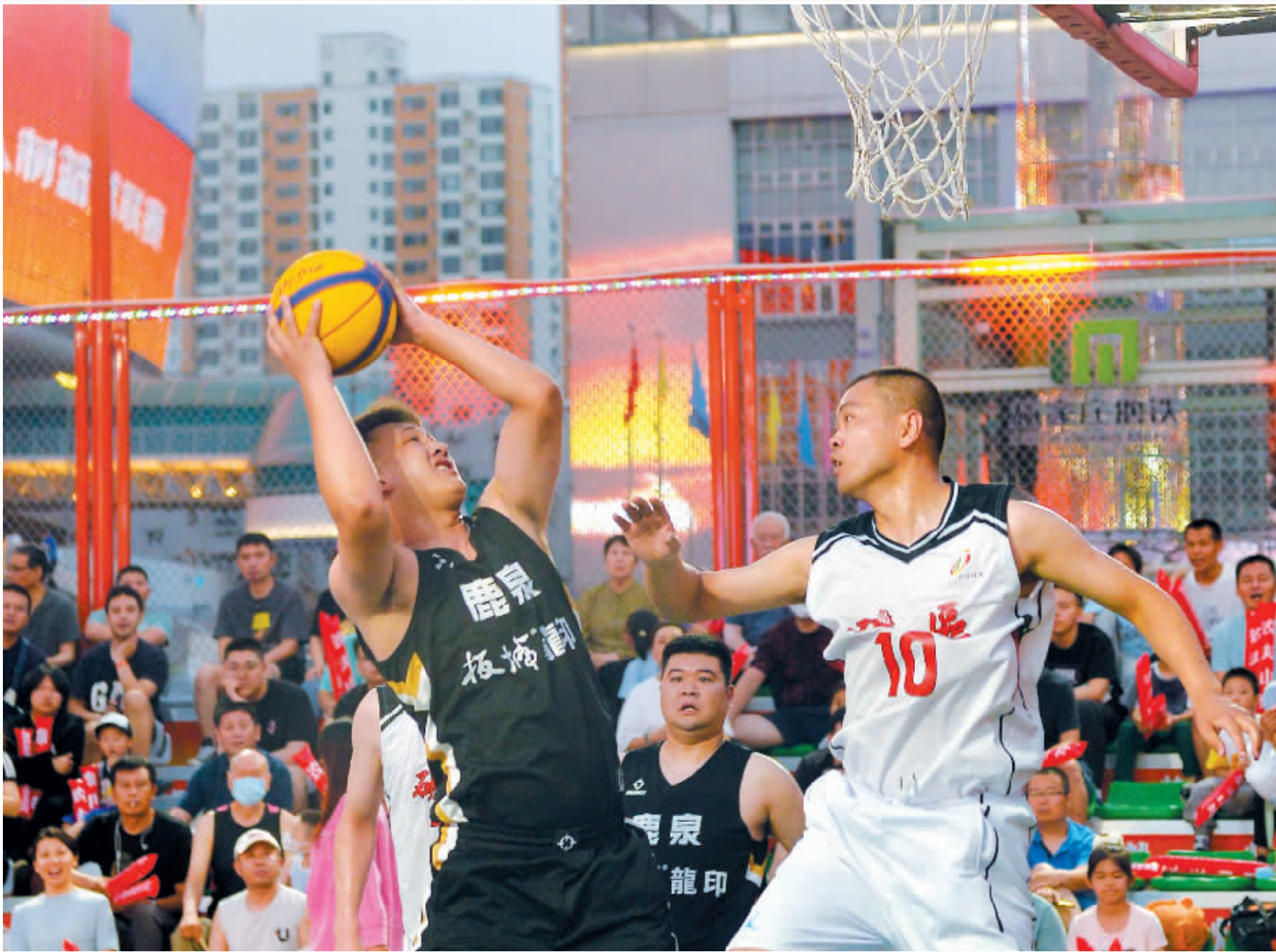
华灯初上,来自鹿泉区和矿区的两支球队在裕彤体育中心篮球公园进行激烈的比赛。6月16日是石家庄市全民三人制篮球联赛县区组的比赛日,精彩的赛事吸引了众多市民前来观看。