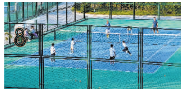
高铁片区中央绿色体育公园的室外网球场,吸引了众多网球爱好者打球锻炼。