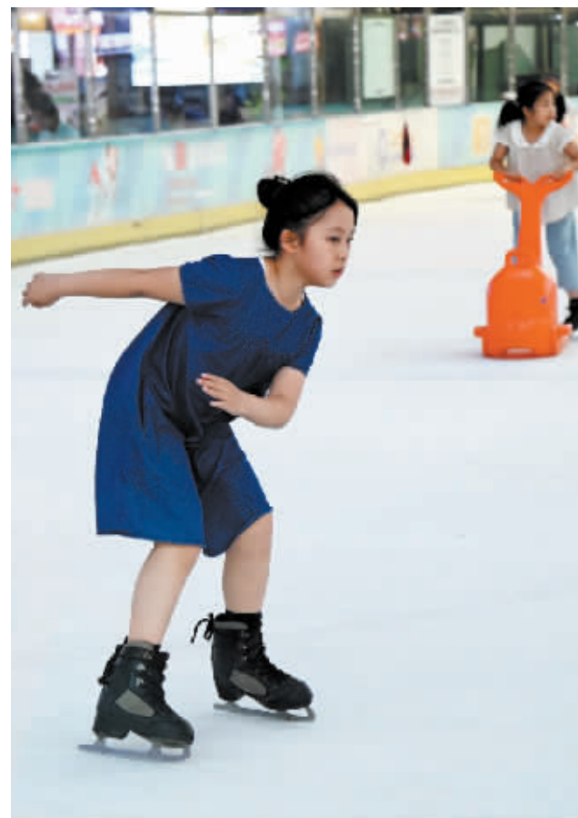
炎炎夏日,孩子们在室内滑冰场享受冰雪运动带来的快乐。