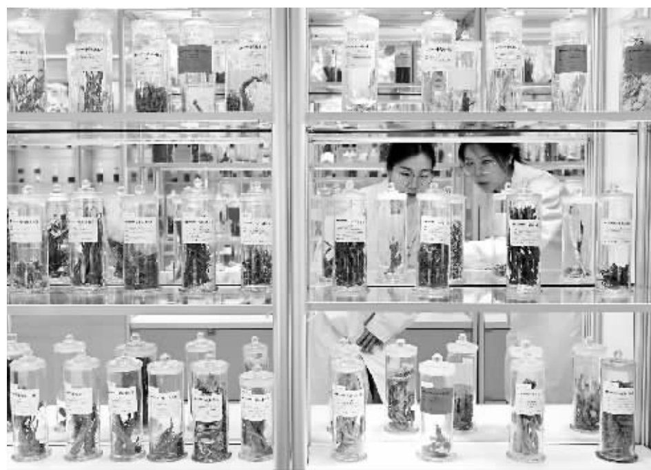
▲生物医药产业是技术密集型产业，信息、人才、技术等创新要素是产业发展最大的驱动力。图为2024年5月7日，技术人员在位于石家庄高新区的一家药企中药标本馆整理标本。

看到，石家庄在生物医药产业集群发展上还存在产业规模不够大，产业集聚不快、产业内部协作紧密度不高、短板弱项。下一步，要主动融入全球产业链、价值链和创新链，培育具有影响力的链主企业，加快建设绿色工厂、绿色工业园区。