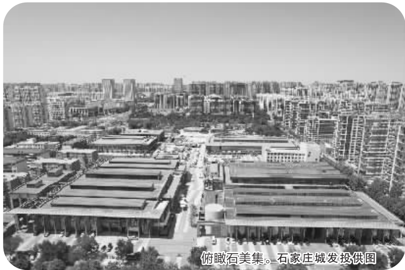
俯瞰石美集。

位于煤机街与跃进路交叉路口的石美集城市微度假中心，是由石煤机老厂更新改造而成，镌刻着石家庄工业发展的历史脉络，见证着这座城市的蓬勃发展。如今，“石美集”以石煤机老厂区原有的6座旧厂房为载体，