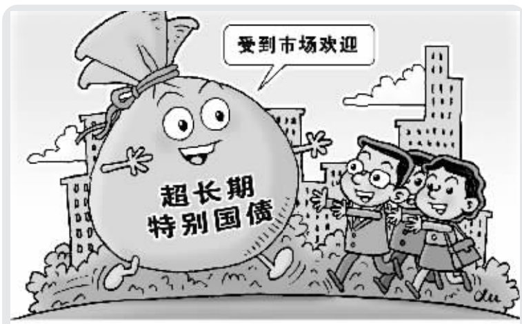
受到欢迎。新华社发 徐骏 作