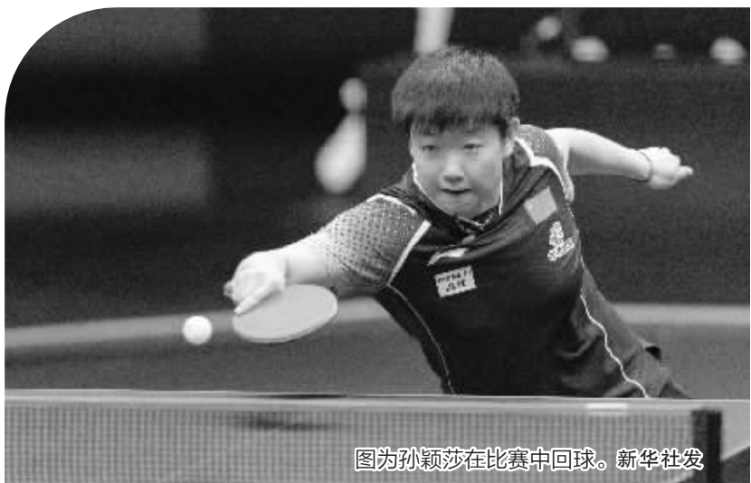
图为孙颖莎在比赛中回球。

本报讯 (记者 刘真) 6月3日晚上,WTT世界乒联重庆冠军赛进行了最后一个比赛日争夺。在女单决赛中,孙颖莎与队友王曼昱展开了一场经典的巅峰之战,孙颖莎两度落后两度逆转,最终决胜局以11比9绝杀王曼昱,夺得本次重庆冠军赛女单冠军。