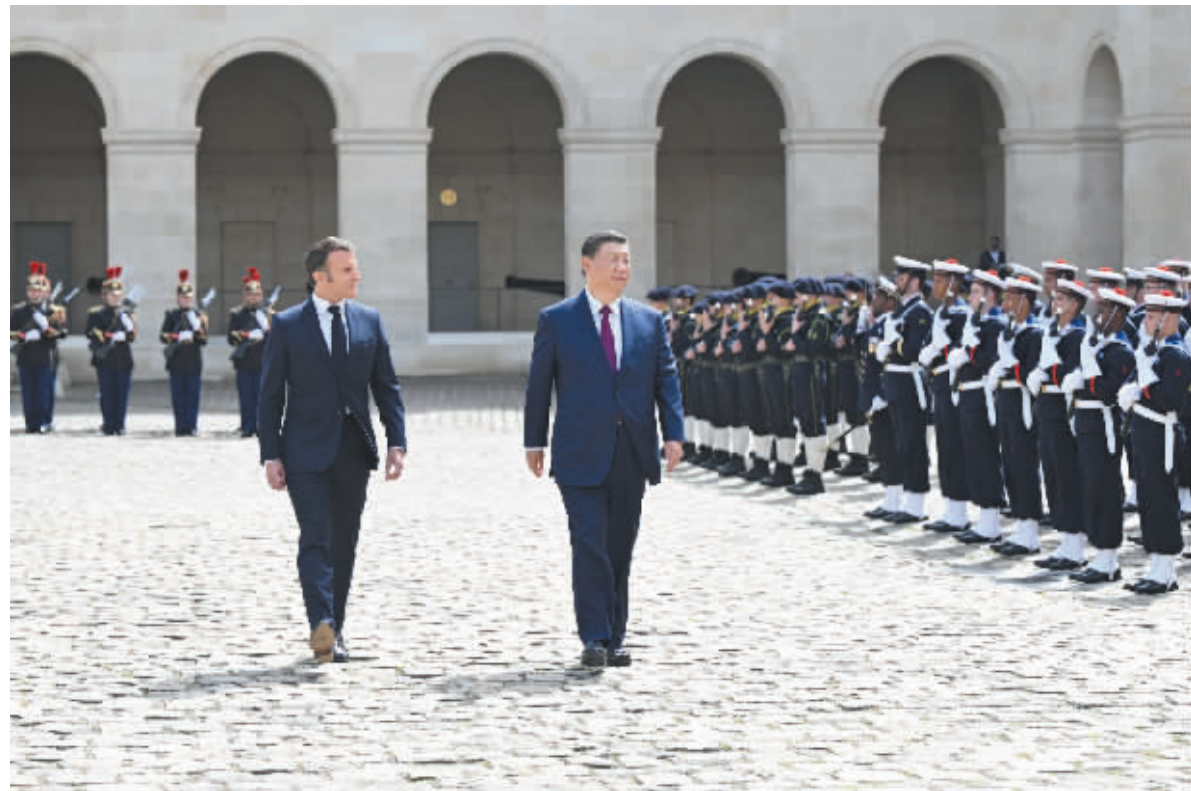
当地时间5月6日下午,正在法国进行国事访问的国家主席习近平在巴黎出席法国总统马克龙举行的隆重盛大欢迎仪式。这是两国元首检阅法兰西共和国卫队和陆海空三军仪仗队。