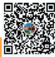
敬业旅游区快手官方号