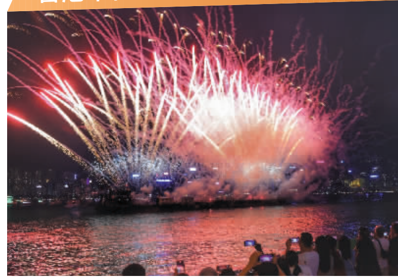
5月1日，人们观看“五一”海上烟火表演。当日，“五一”海上烟火表演在香港维多利亚港举行。表演历时10分钟，燃起香港假期旅游新热潮，拉开“五一”假期的序幕。