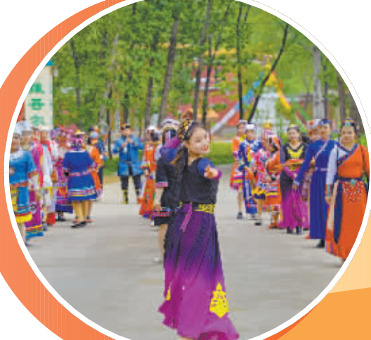
精彩的少数民族演出。