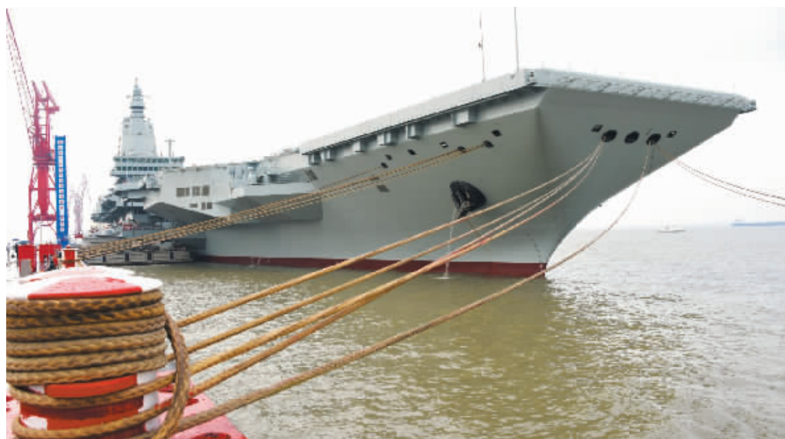
►这是即将从上海江南造船厂码头解缆启航的福建舰。

根据航母建造工程进展，这次海试主要检测验证福建舰动力、电力等系统的可靠性和稳定性。自2022年6月下水以来，福建舰建造工作按计划稳步推进，顺利完成系泊试验和装设备调试，具备出海进行试验的技术条件。