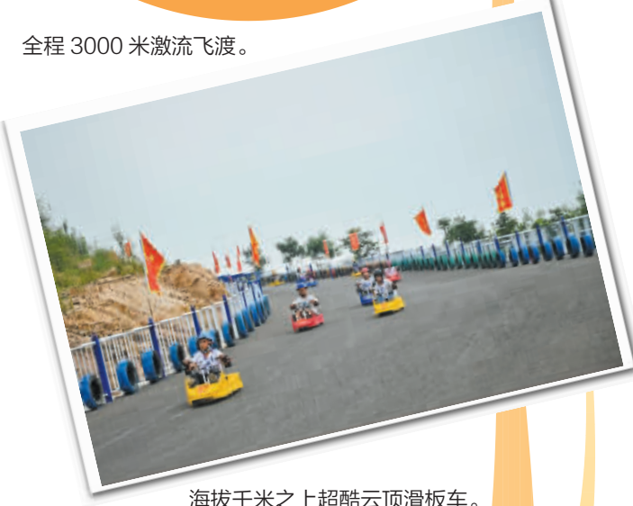
海拔千米之上超酷云顶滑板车。