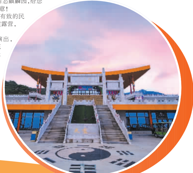
美轮美奂天宫胜景。