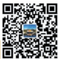
敬业旅游区官方公众号