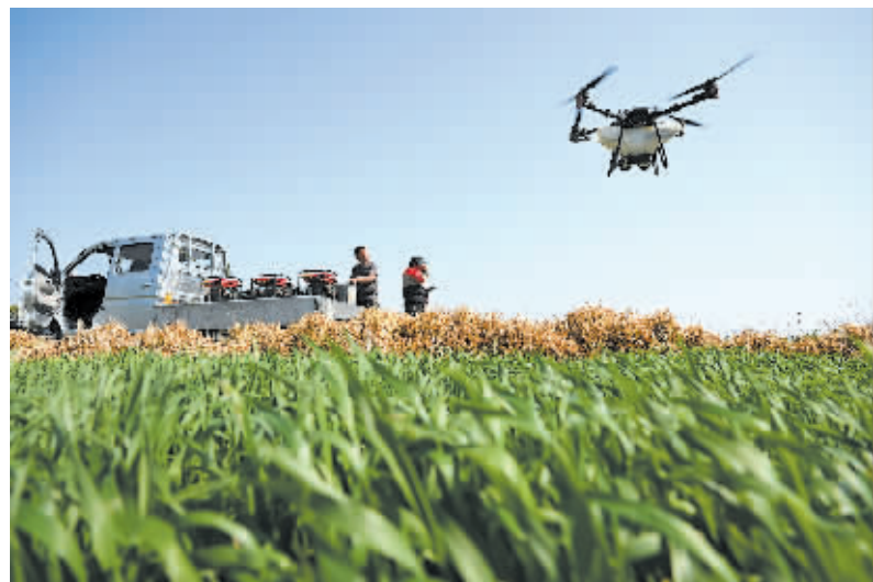
2024年3月22日，在安徽省合肥市庐江县同大镇，工作人员操作植保无人机为小麦施肥。