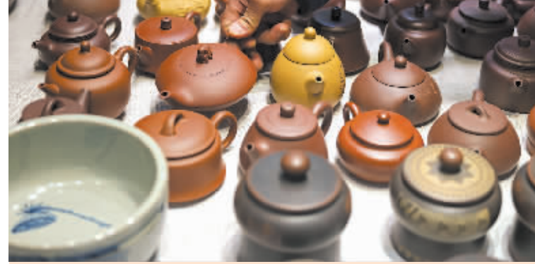
4月19日，一名观众在北京茶博会上挑选茶壶。第十六届北京国际茶业及茶艺博览会于4月19日至22日在北京全国农业展览馆举办。本届茶博会汇聚700多家参展商，产品涵盖六大茶类、茶具与周边配套等产品，展出面积近24000平方米。