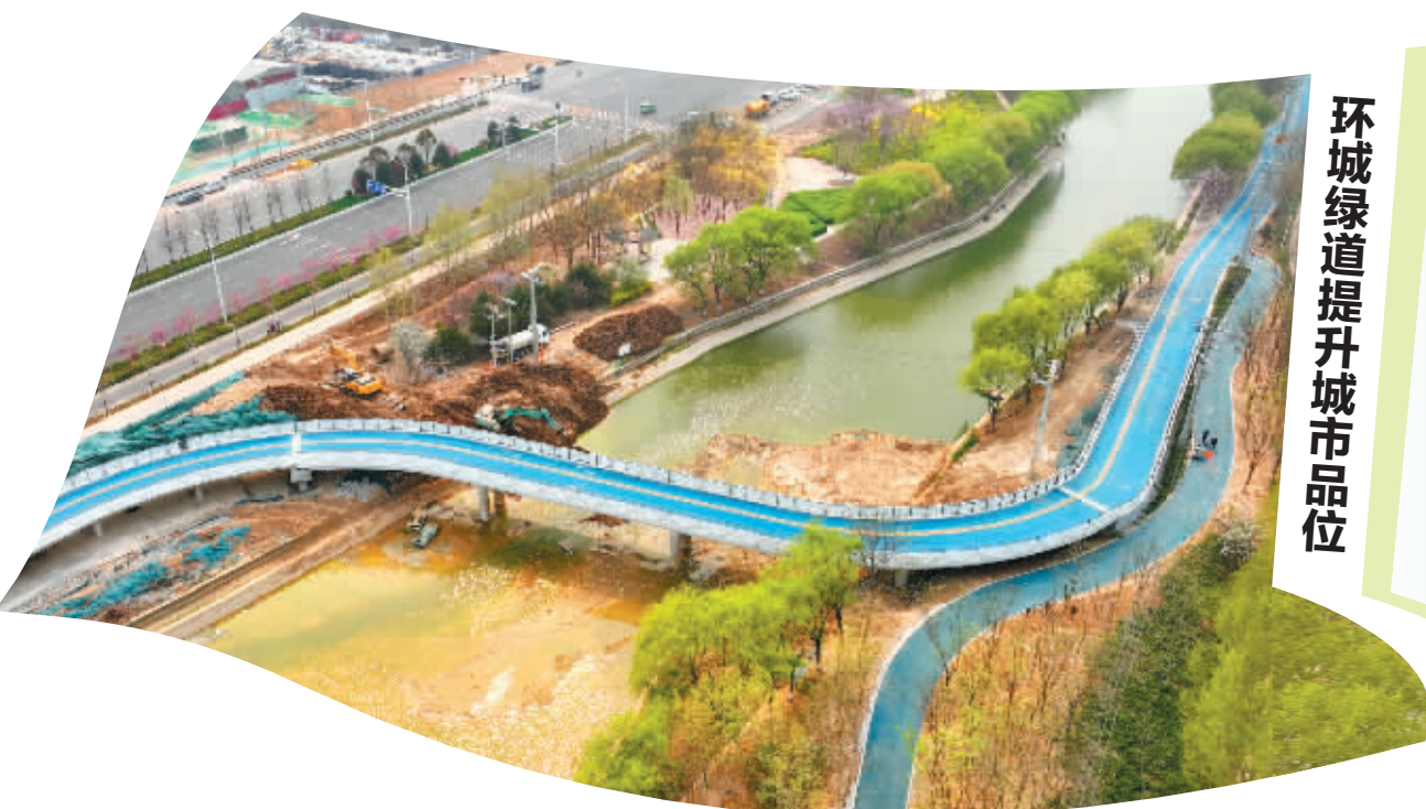
环城绿道提升城市品位

全长101公里的石家庄市环城绿道各项工程正在加速建设,建成后将具备全民无障碍自由步行、骑行功能,为市民提供一个安全、便捷、独特的健身场所。图为4月8日拍摄的环城绿道南线。