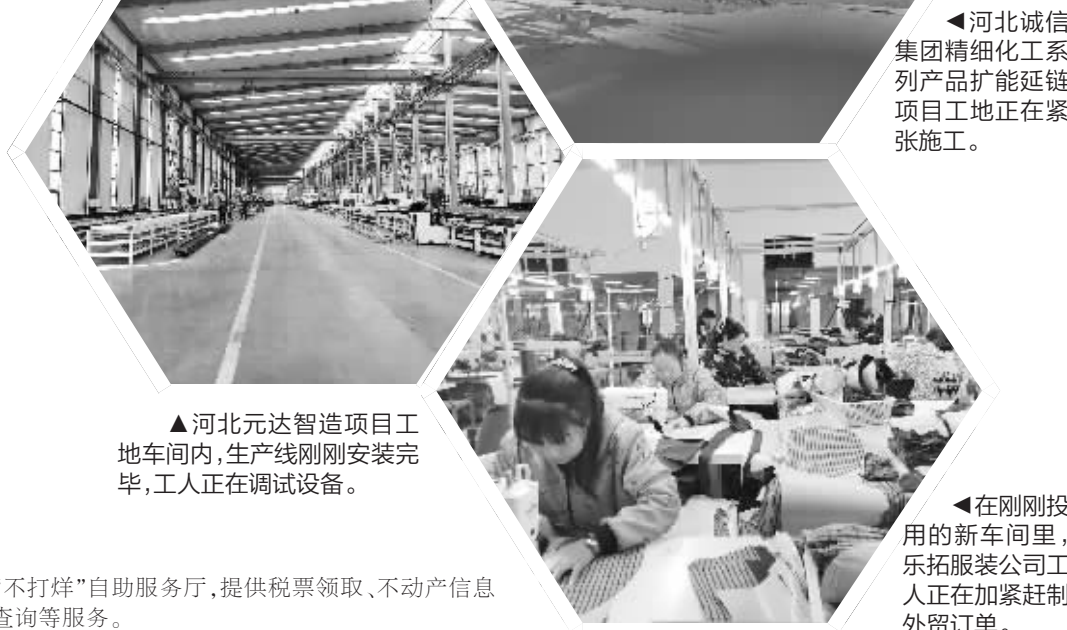
▲河北元达智造项目工地车间内，生产线刚刚安装调试完毕，工人正在调试设备。

落实专人盯办、上门服务只是该县优化营商环境中的其中一环。近年来，元氏县不断探索集成服务模式新模式，在审批大厅综合受理“一件事一次办”窗口，推出68项套餐服务，将32个部门545项“应进必进”事项清单、32项不涉及事项全部入驻政务服务大厅，实现“一次一门办理，一窗一站服务”。此外，该县还在政务服务中心打造24小时