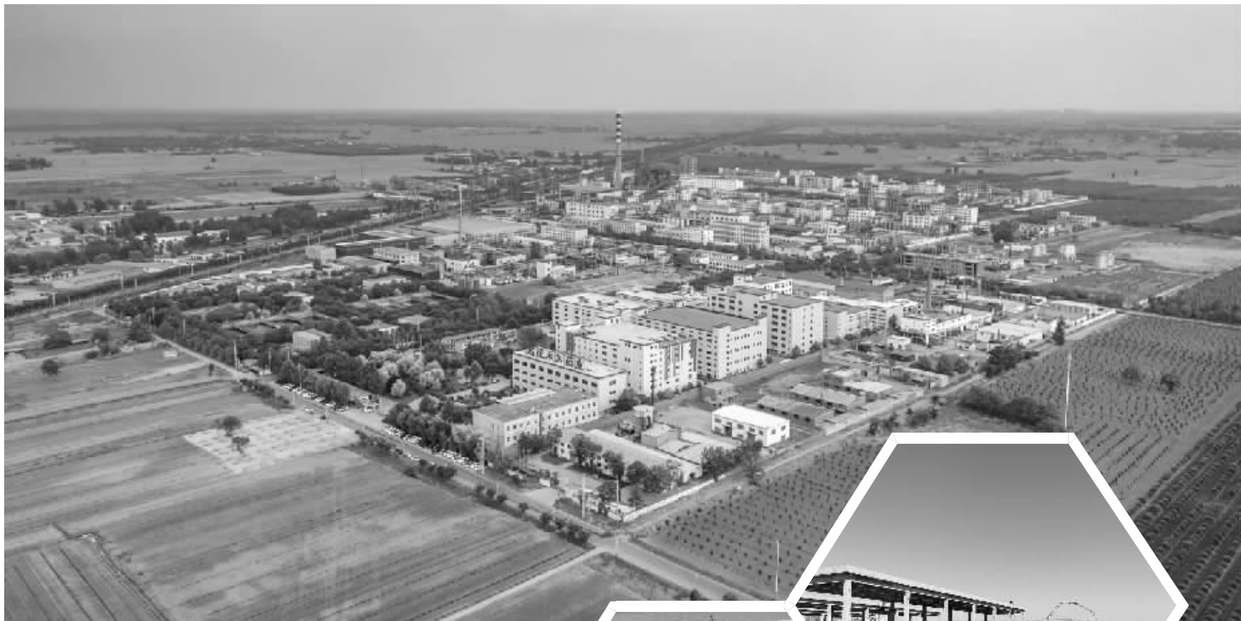
元氏县经济开发区医药产业园。

吸引众多企业扎根元氏是做高能级、做大规模、做优结构的关键所在，元氏县牢固树立项目为王理念，优