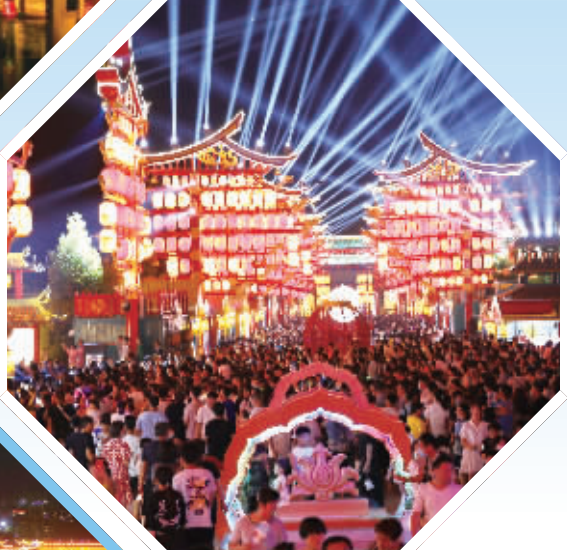
夜色下的 正定古城