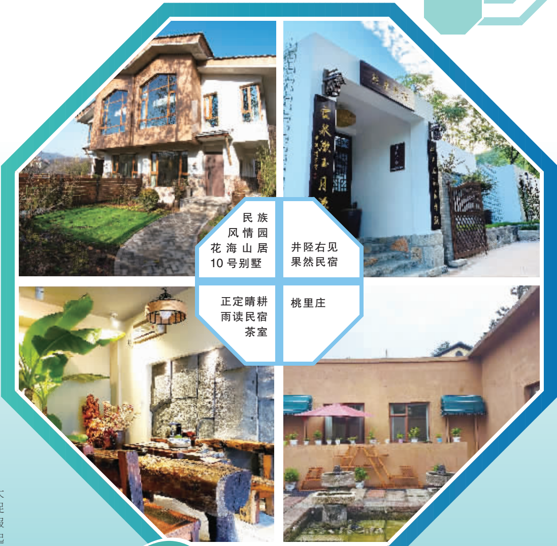
民族风情园 花海山居 10号别墅