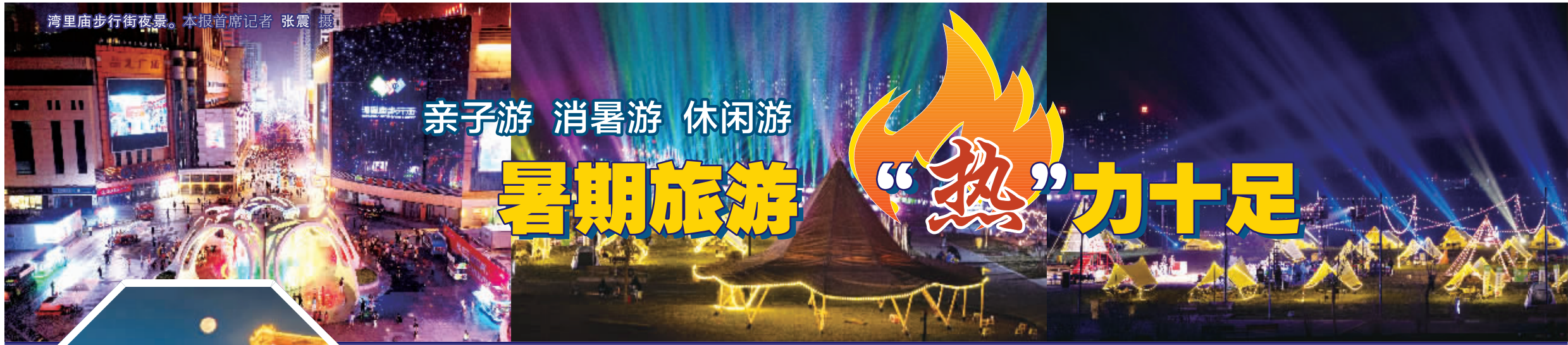
湾里庙步行街夜景。