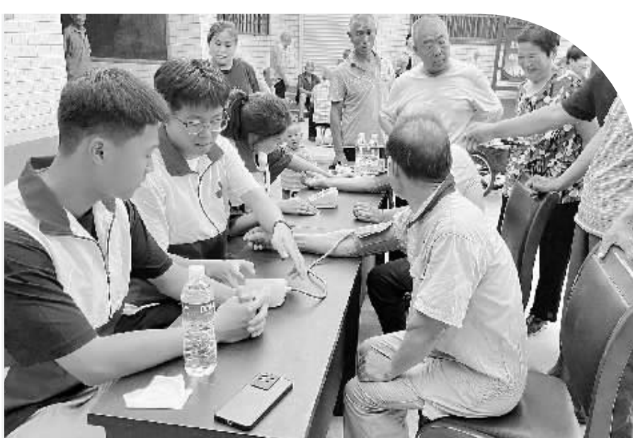
石家庄信息工程职业学院急救救护小分队为村民测血压。

2023年河北省普通高校招生录取工作已落下帷幕,各高校的录取通知书也在陆续发放中,收到录取通知书的准大学生即将迈入人生新阶段。省教育考试院提醒,在开学来临之际,大一新生要做好入学充分准备,确保顺利入学。