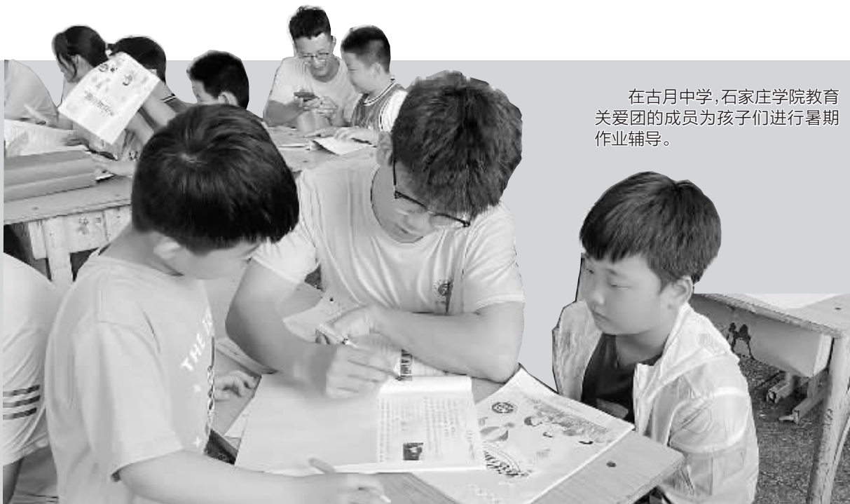
在古月中学,石家庄学院教育关爱团的成员为孩子们进行暑期作业辅导。

为引导和帮助广大青年学生在与实践相结合的“大思政课”中“受教育、长才干、作贡献”,引领广大青年学生积极拓宽实践课堂、成长平台。今年暑假,我市多所高校积极组织学生开展暑期文化科技卫生“三下乡”社会实践活动,让青春之花在基层绽放。