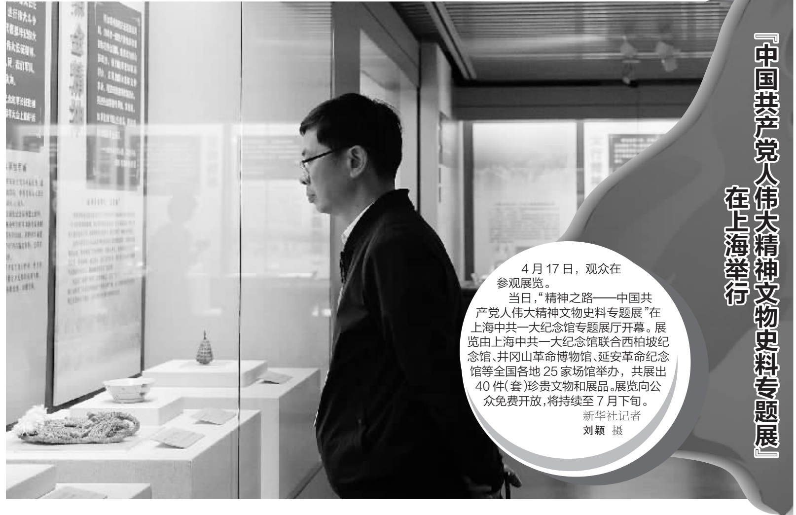
『中国共产党人伟大精神文物史料专题展』在上海举行

4月17日,观众在参观展览。 当日,“精神之路——中国共产党人伟大精神文物史料专题展”在上海中共一大纪念馆专题展厅开幕。展览由上海中共一大纪念馆联合西柏坡纪念馆、井冈山革命博物馆、延安革命纪念馆等全国各地25家场馆举办,共展出40件(套)珍贵文物和展品。展览向公众免费开放,将持续至7月下旬。