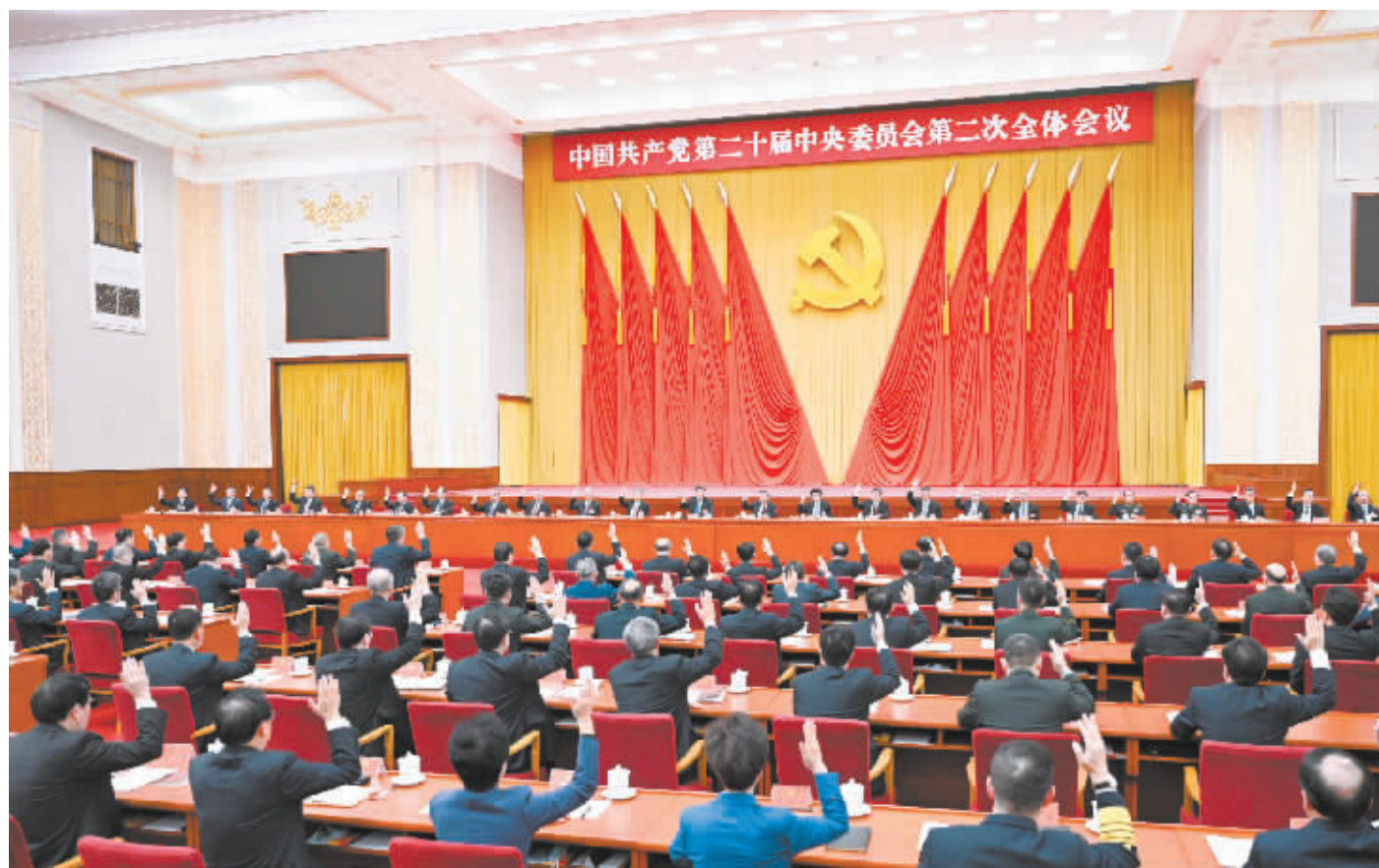
中国共产党第二十届中央委员会第二次全体会议，于2023年2月26日至28日在北京举行。中央政治局主持会议。