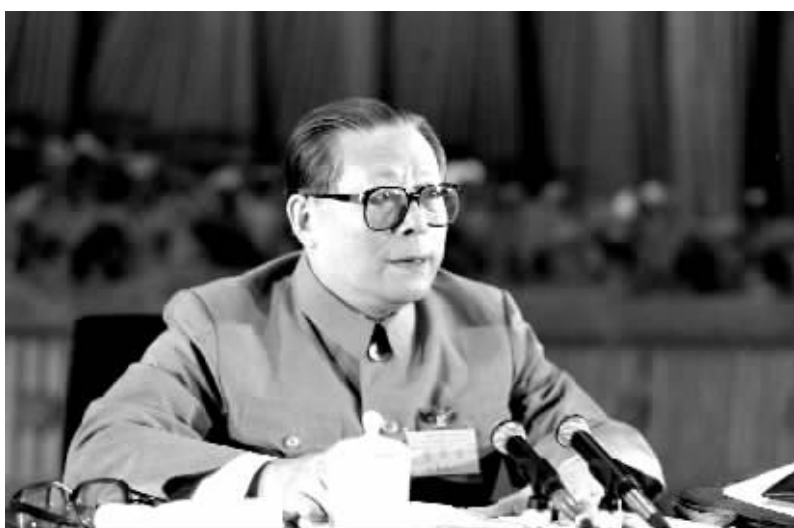
上图:1989年6月23日至24日,中国共产党第十三届中央委员会第四次全体会议在北京召开。这是江泽民同志在会上讲话。