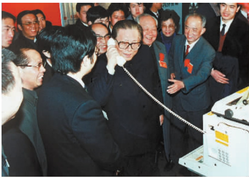
上图:1984年5月,江泽民同志在北京展览馆举行的全国电子新产品展览会上,试用国际长途电话向远方的工作人员问候。