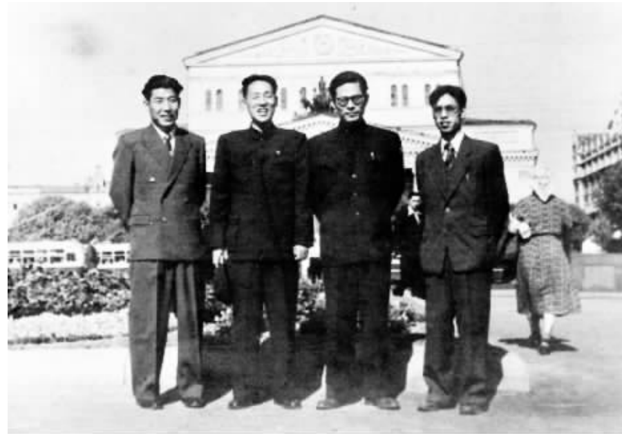
上图:1955年至1956年,江泽民同志(右二)曾在莫斯科大林汽车制造厂实习。这是江泽民等在莫斯科合影。