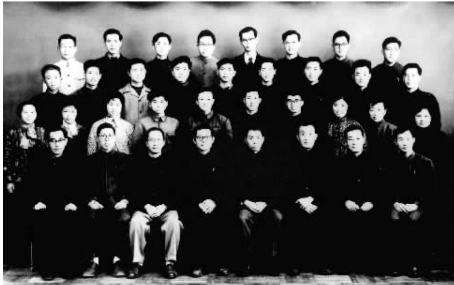
上图:1963年3月,江泽民同志(前排右五)在上海同小型三相异步电机全国统一系列设计领导小组成员合影。