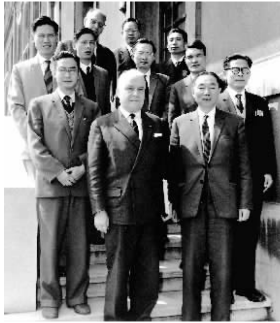
上图:1964年6月,江泽民同志(二排右一)在法国艾克斯莱班出席国际电工委员会会议期间与会代表合影。