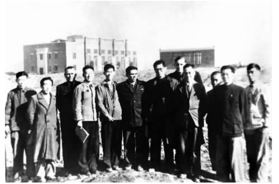
上图:1956年,江泽民同志(左七)在长春第一汽车制造厂同援建一汽的苏联专家等合影。