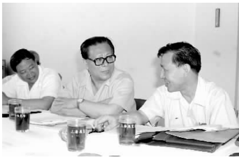
上图:1985年,江泽民同志在上海市八届人大四次会议上。