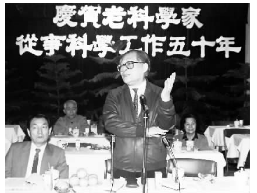
上图:1988年10月,江泽民同志在上海庆贺老科学家从事科学工作五十年座谈会上讲话。