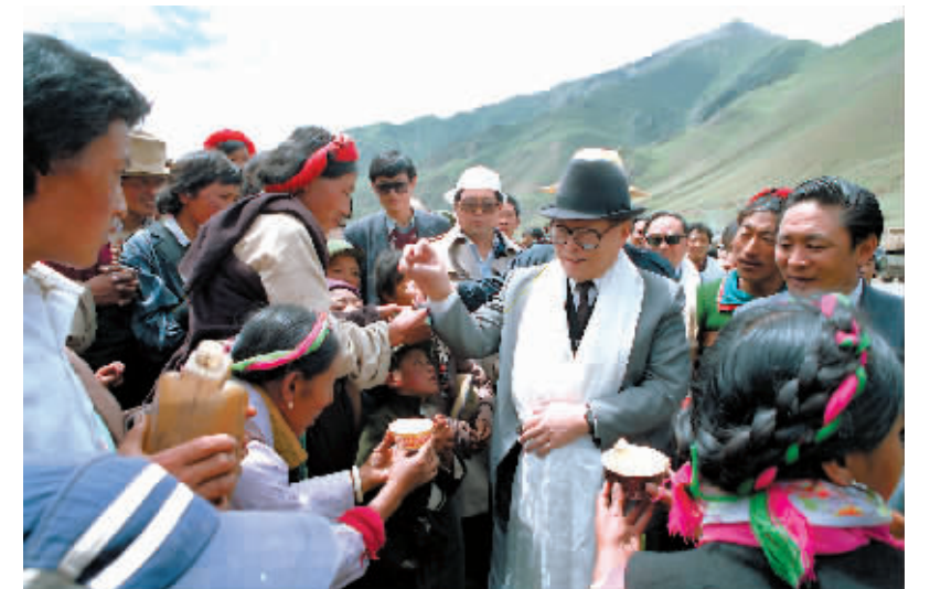
上图:1990年7月25日,江泽民同志与藏族群众共庆望果节。