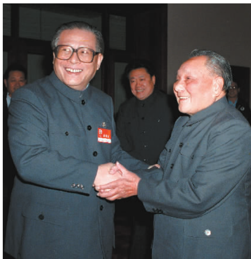
右图:1989年11月6日至9日,中国共产党第十三届中央委员会第五次全体会议在北京召开。这是邓小平同志和江泽民同志亲切握手。