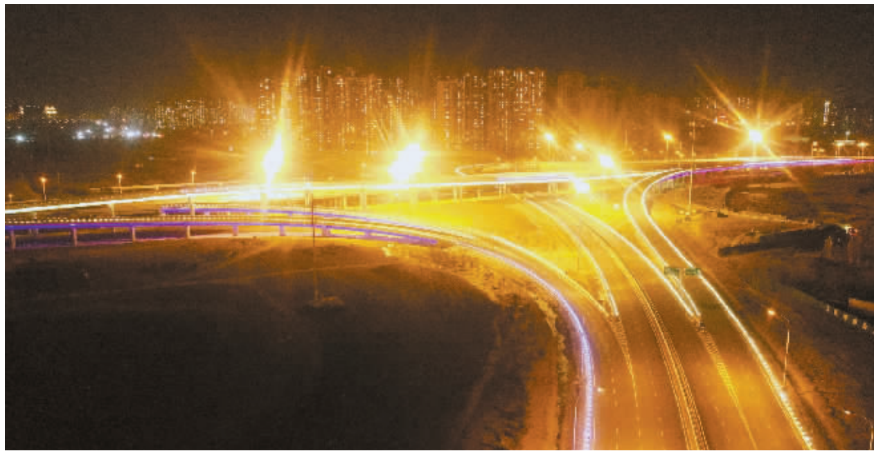
11月25日，复兴大街与南二环东延互通立交亮化工程全部完成，流光溢彩的夜景效果为城市增添靓丽色彩。道路亮化采用LED智能控制系统，夜景灯光统一调度控制，可实现不同时间、不同车流量情况下自动调节夜景的亮度和照明模式，呈现出美轮美奂的效果。