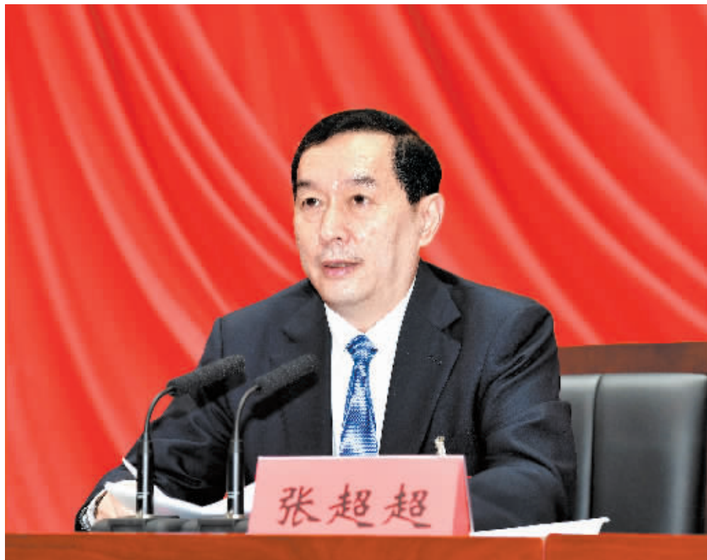
11月2日，中国共产党石家庄市第十一届委员会举行第四次全体会议。市委书记张超超代表市委常委会讲话。

全会听取和讨论了张超超受市委常委会委托作的工作报告，审议通过了《中国共产党石家庄市第十一届委员会第四次全体会议决议》