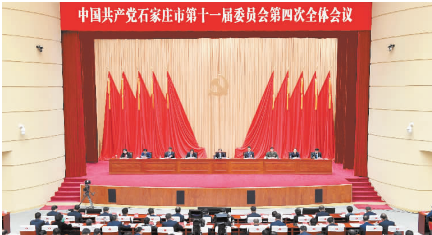
11月2日，中国共产党石家庄市第十一届委员会举行第四次全体会议。这是会议现场。