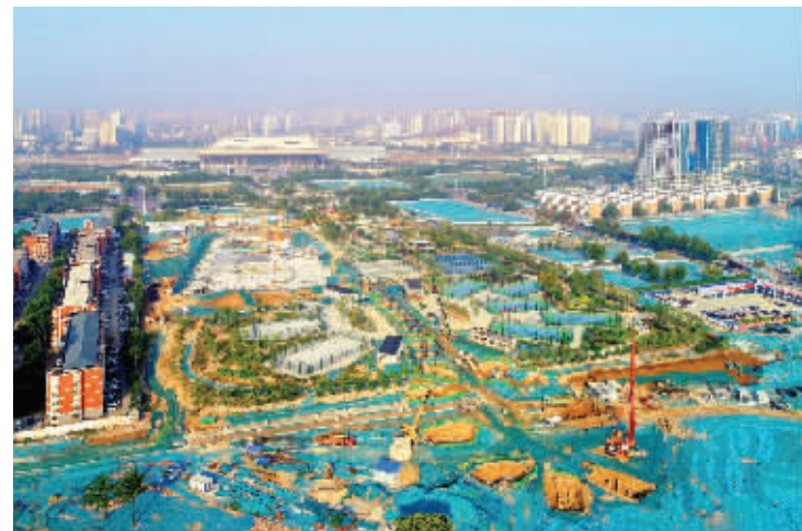
加紧建设施工中的高铁片区项目。