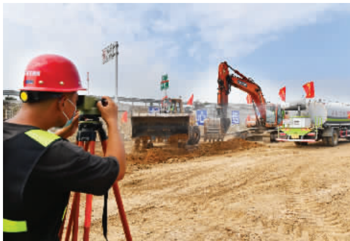
石家庄市北三环市政化改造项目现场，大型施工车辆往来穿梭，建设者们进行道路改造的基础施工。

继复兴大街与新城大街互通立交、复兴大街与南二环东延线互通立交建成通车后，全线三座隧道全部进入主体开挖施工阶段以来，复兴大街市政化改造重要控制性工程滹沱河特大桥开工。与此同时，总长35.1公里的北三环市政化改造工程，进入主线全面施工阶段，未来，北三环将由双向4、6车道高速公路改造为双向12车道市政道路，将极大改善片区交通环境，与沿线相交道路，共同拉开城市发展框架，成为省会北部交通主干道、城市快捷路，有力承接滹沱河经济带辐射，促进产业转型升级，激发片区发展活力，高质量改善人居环境，提升城市品质，全面展示省会城市新风采。