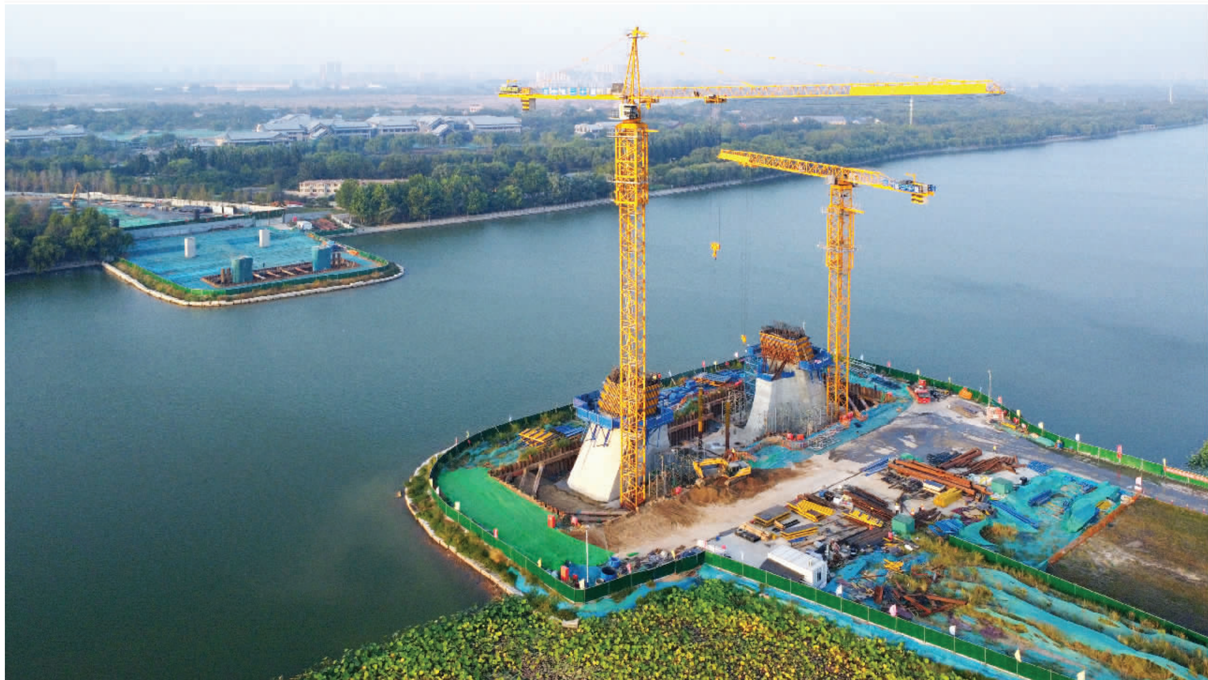
全力施工建设中的学府路东延跨太平河桥梁工程。