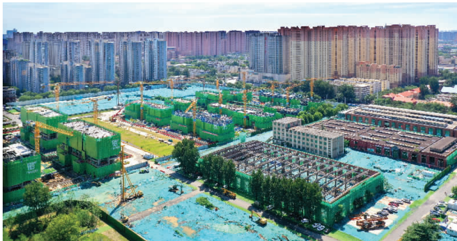
石煤机城市更新项目现场，工作人员进行立体园林住宅区和工业遗存保护区的建设。