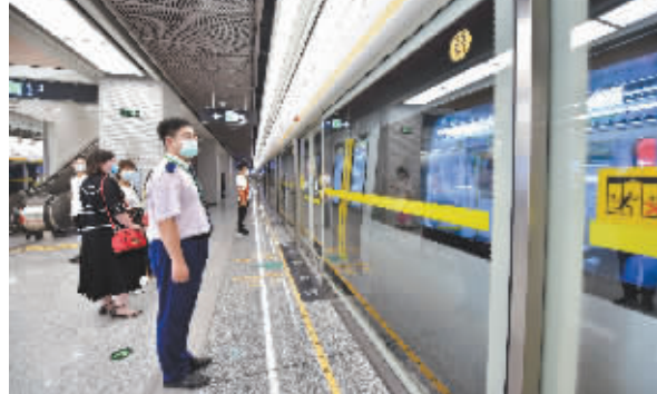
值守车站的地铁人。