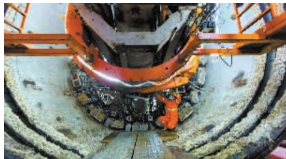
地铁1号线二期北段工程首台盾构机在地铁1号线东上泽站顺利始发。