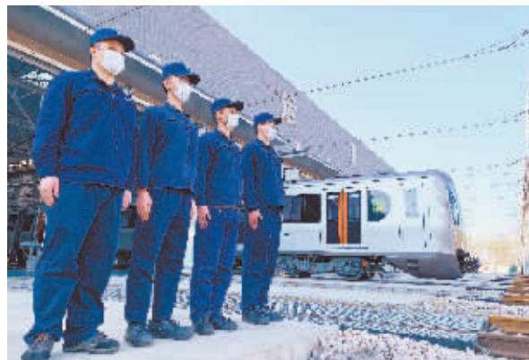
车辆检修工作人员在西北通车辆段运用库前备班。

石家庄交投集团副总经理、轨道集团董事长周伟表示:“通车五年来,石家庄地铁运营平稳有序,各项指标良好,行车组织不断优化,服务水平持续提升,便民惠民举措频出,充分发挥着轨道交通对于优化城市布局、缓解城市拥堵、提升城市品位、彰显城市文明的重要作用。今后,轨道集团将在市轨道办和交投集团的坚强领导下,继续秉持‘实干兴石、舍我其谁’的奋斗精神,加快剩余在建工程建设,积极筹备二期建设各项前期工作,不断完善轨道交通线网,着眼轨道交通可持续发展,为建设现代化、国际化美丽省会城市不懈奋斗。”