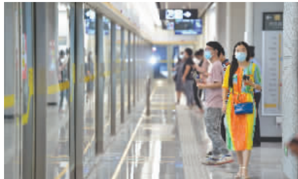
正在地铁站候车的市民。