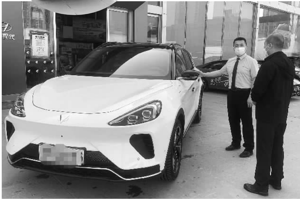
新能源汽车受到越来越多市民青睐。图为在省会某汽车销售店,一位市民正在选车并咨询相关保险等事宜。