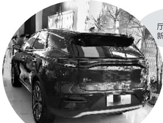
图为汽车销售大厅里展示的一辆新款新能源汽车。

对车主而言,必要的新能源车险自然是“必选项”,该买的还得买。对车企、险企而言,仍需结合市场需求不断创新,推出更能满足消费者需求的服务,让消费者更便捷、更放心、更实惠。对相关部门而言,也应高度重视,及时研判,加强监管。通过多方努力,共同促进新能源车市场的健康发展,让更多新能源车“行有险保”。