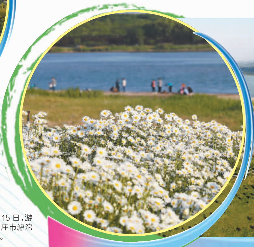
5月15日,游客在石家庄市滹沱河畔观光。