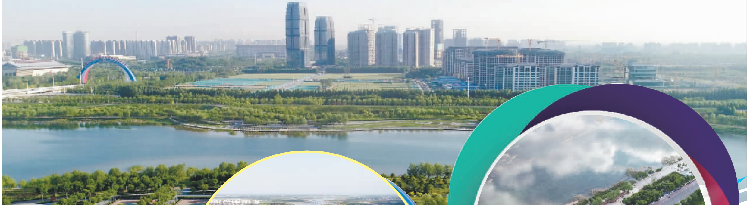
5月16日拍摄的石家庄市滹沱河景色(无人机照片)。

滹沱河是石家庄的“母亲河”。近年来,石家庄市对境内滹沱河流域实施了生态修复工程,通过修路筑堤、疏浚河道、回填沙坑、恢复湿地、建坝蓄水、湖泊水生态环境恢复、植树绿化等综合整治,目前已形成了集防护、观赏、休闲、健身和科普五大功能于一体的绿色生态景观长廊。