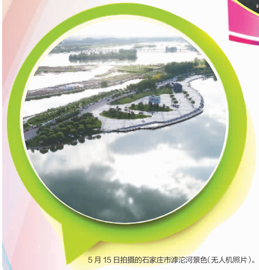
5月15日拍摄的石家庄市滹沱河景色(无人机照片)。