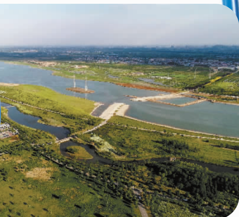
5月15日拍摄的石家庄市滹沱河景色(无人机照片)。