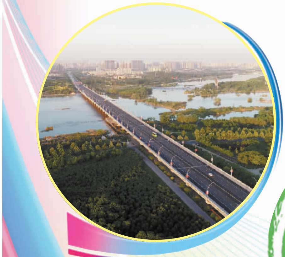
5月16日拍摄的石家庄市滹沱河景色(无人机照片)。