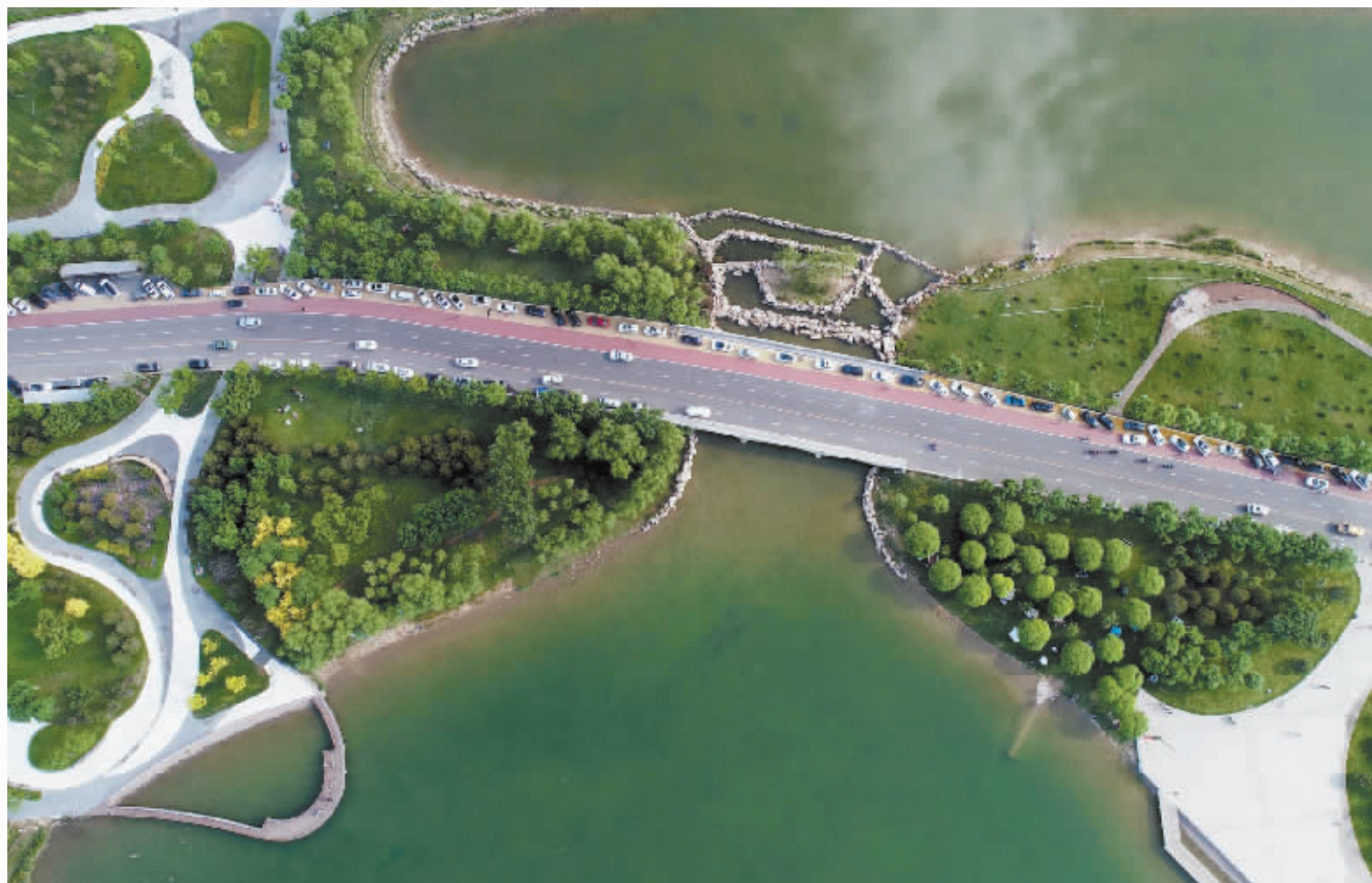
5月15日,游客在石家庄市滹沱河畔观光(无人机照片)。