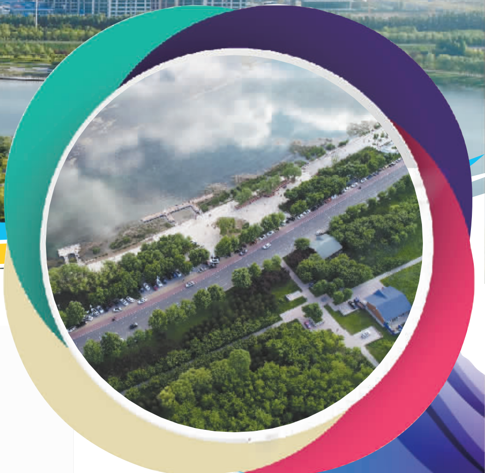
5月15日拍摄的石家庄市滹沱河景色(无人机照片)。