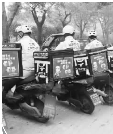
图为外卖小哥化身“消防监督员”。

截至目前,裕华消防大队共张贴外卖消防宣传彩页2000余份,超市购物车上万份,消防宣传公益使者宣传海报上万份。