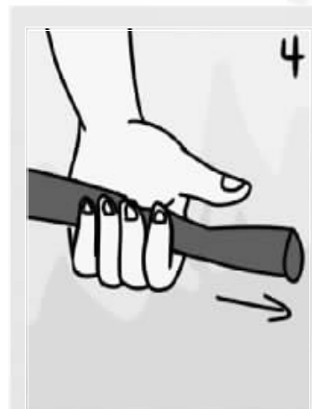
对准火源根部扫射