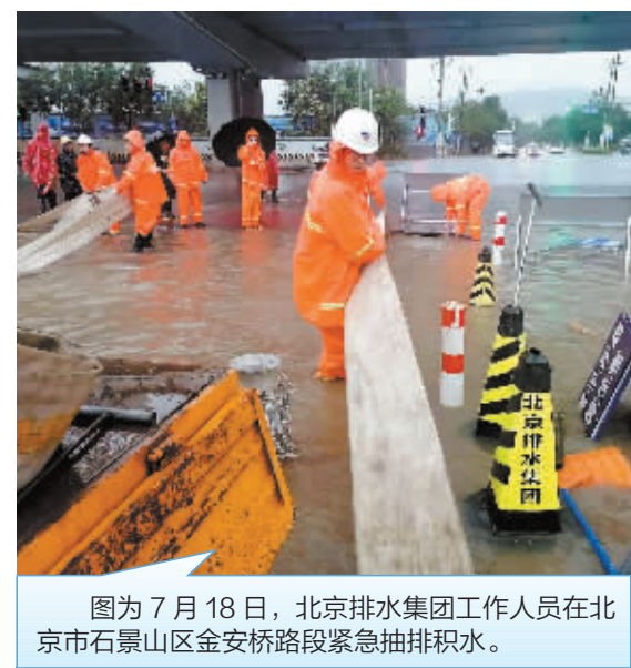
图为7月18日，北京排水集团工作人员在北京市石景山区金安桥路段紧急抽排积水。

新华社北京7月18日电 国家防总副总指挥、水利部部长李国英18日主持召开防汛会商会，研判“七下八上”防汛关键期汛情形势，强调要细化实化防御措施，超前做好应对准备。