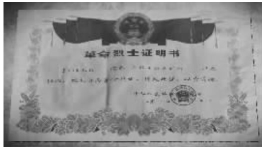
素云烈士的《革命烈士证明书》。

斯人已去，浩气长存。素云烈士和戎冠秀的雕像一起陈列在解放石家庄烈士陵园。2011年4月2日，中华人民共和国民政部批准，追认素云为革命烈士。而记载素云烈士英勇事迹的那些小纸片也被中国人民解放军档案馆永久收藏。