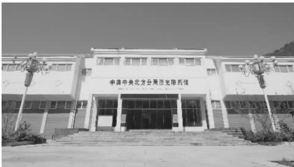
2008年，平山县建成中共中央北方分局历史陈列馆。

为了纪念这段不同寻常的岁月，2008年，平山县建成中共中央北方分局历史陈列馆。大量翔实的图文、文物，生动再现了晋察冀边区军民团结一致抗击日本侵略者的光荣历史，自开放至今，累计接待近百万人次参观。2013年，中共中央北方分局历史陈列馆被列为河北省爱国主义教育基地。