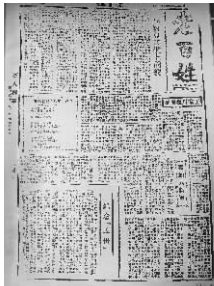
▲1939年5月30日《抗敌报》副刊版刊发文章《王家川没有死》。