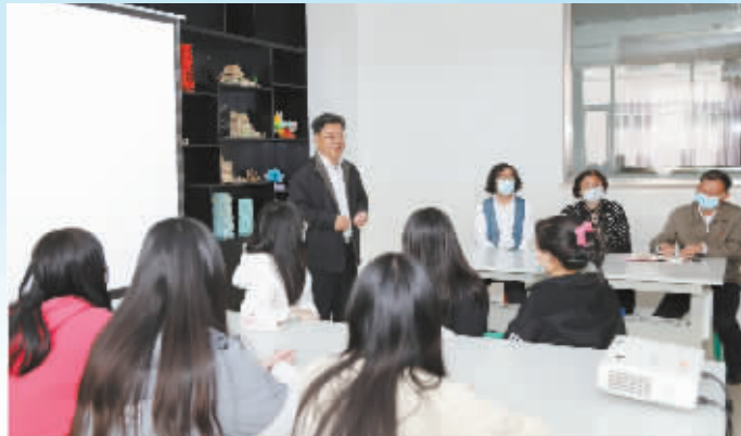
主题班会感悟劳动精神。