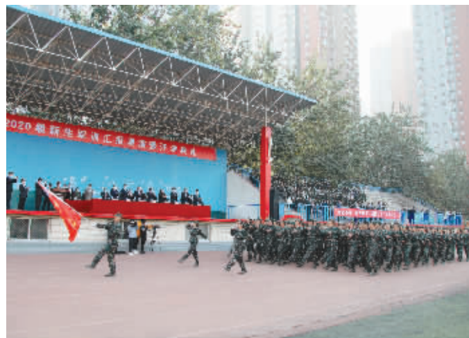
军训队伍步履铿锵。