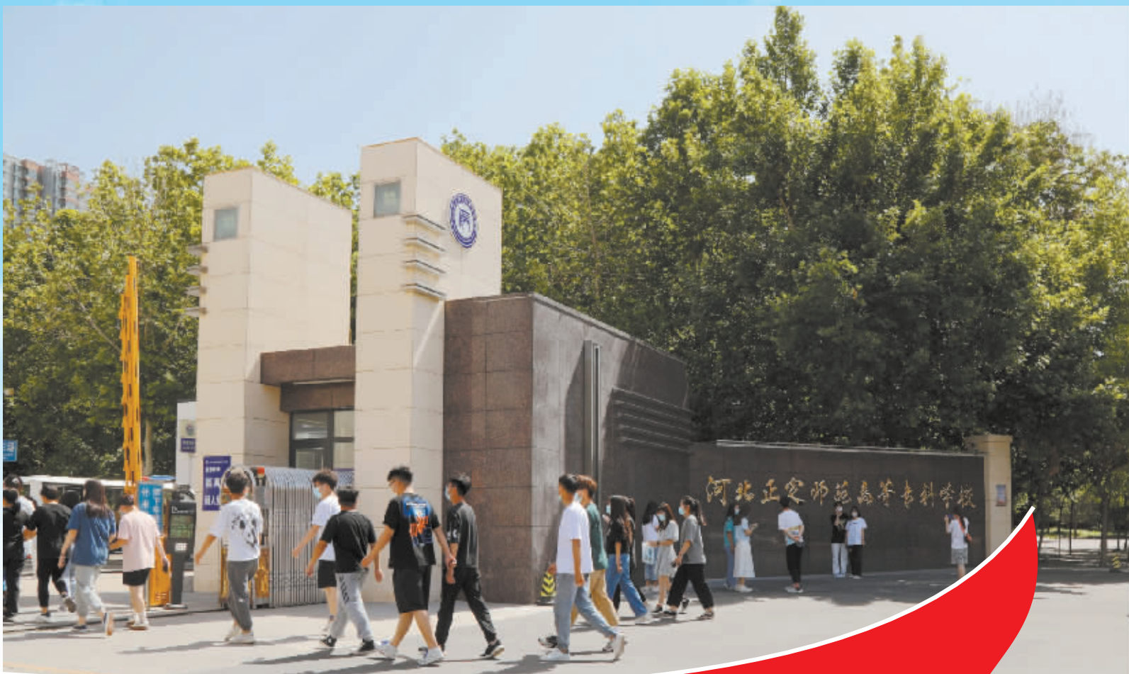
河北正师梦想再起航。