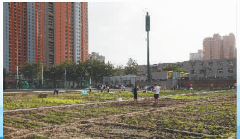
劳动基地热火朝天。