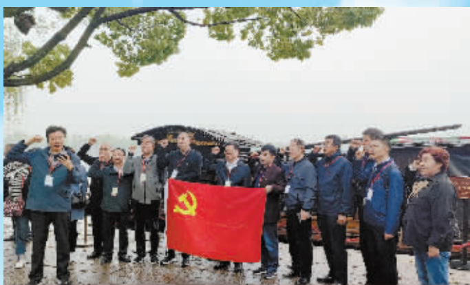
南湖红船庄严宣誓。