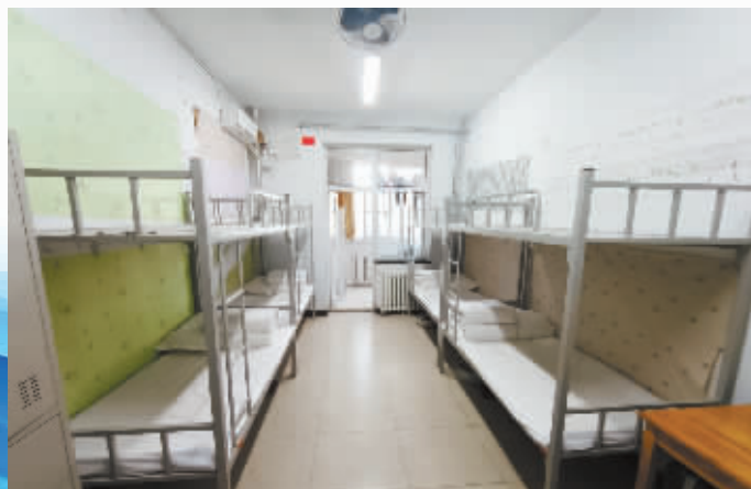
学生宿舍窗明几净。