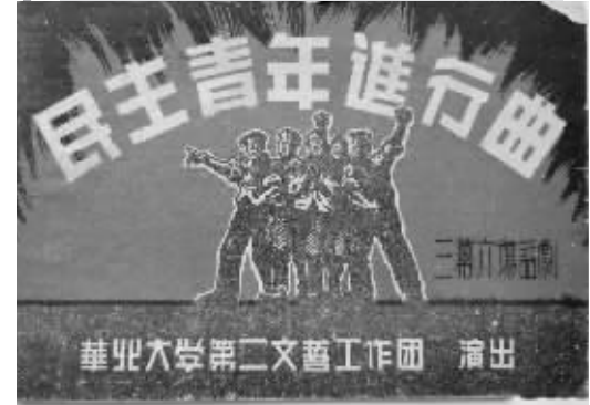
《民主青年进行曲》的节目单。