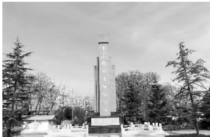
平山团诞生地纪念碑