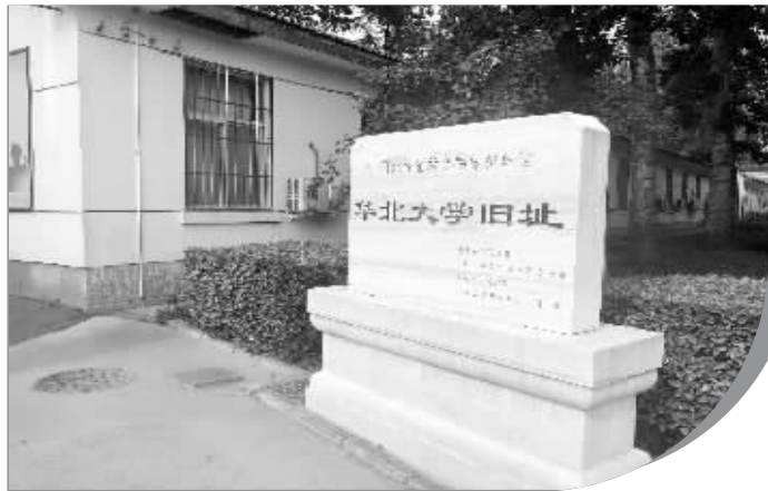
华北大学旧址为河北省文物保护单位。