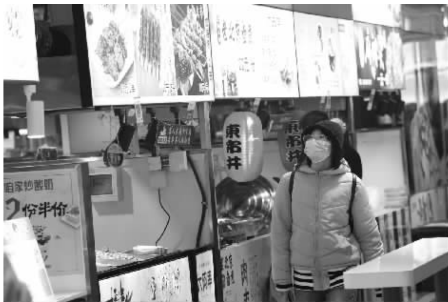
图为市民在省会某餐饮店浏览选择心仪的美食。

日前,市夜经济建设领导小组办公室组织编写了《石家庄夜经济行业发展白皮书》,结合大数据,对我市十多年来夜间生活中涵盖的各类业态进行了多维度分析,为进一步深化夜经济建设,满足市民与游客的夜间生活与消费需求提供数据与经验参考。