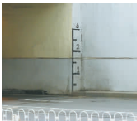
△市内地道桥水位线 ▷太原地道桥水位标尺 资料图

我市市区有40多座地道桥,目前有30多座已设立了水位线,但只是在桥的一侧设立,主要是供排水管理处工作人员观看视频监控用作参考的。地道桥下能否设立水位标尺,他们将对该建议进行研究,如果切实可行的话,将进行标记或施划。