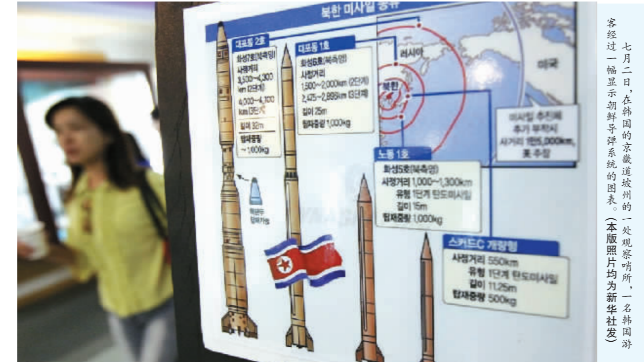
七月二日,在韩国的京畿道坡州的一处观察哨所,一名韩国游客经过一幅显示朝鲜导弹系统的图表。

(四)在安全生产方面,还存在着悖于科学发展观要求的问题。近年来,我市曾发生过“红心蛋”、“黑心肉”以及三鹿问题奶粉等食品安全事件,重大安全事故时有发生,不仅严重损害人民生命安全,而且产生了十分恶劣的影响。这些问题的