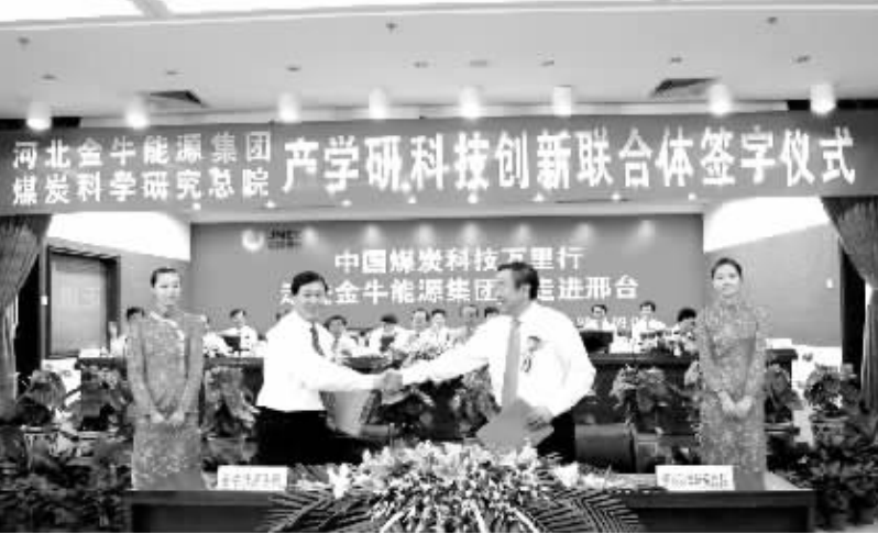
金牛集团依靠科技进步,使企业得到健康发展