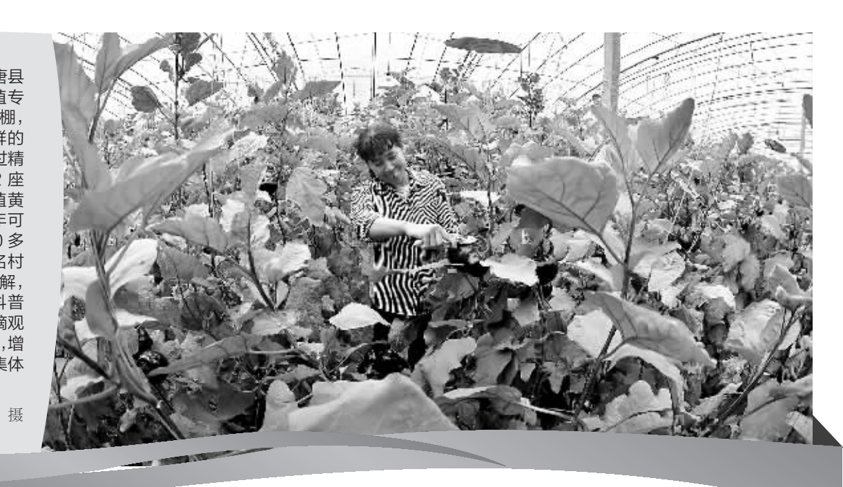
日前,在位于行唐县黄龙港村的占军种植专业合作社日光温室大棚,种植户正在采摘新鲜的蔬菜。该村近年来通过精准扶贫项目建成42座日光温室大棚,种植黄瓜、甜瓜等果蔬,每年可为该村增加收入300多万元,解决了60多名村民的就业问题。据了解,该村还将建设亲子科普产业园、优质苹果采摘观光园等生态农业项目,增加农民收入,壮大村集体经济,助力乡村振兴。

(上接第一版) 近年来,特别是党的十九大以来,我市提出建设现代省会、经济强市的奋斗目标,明确了转型发展、绿色发展、创新发展、率先发展的实践路径,积极构建“4+4”现代产业发展新格局,我市改革发展稳定,各项事业取得新进展、实现新突破。当前,我们也面临着难得的发展机遇和有利因素。但研讨班同时指出,我们的发展现状与中央、省委的要求相比还不相符,工作中还存在不少短板和差距。研讨班聚焦高质量发展,全面建成小康社会的目标,深入研讨了产业布局优化、推进高质量发展、完善高质量发展统计指标体系、国土空间规划体系等重要事项。 短短的时间里,专题研讨班全体学员心无旁骛、集中精力进行了一次高强度、高效率的集体学习。6月9日下午,专题研讨班举行了市委理论学习中心组学习会议,学习了《习近平谈治国理政》第二卷有关“推动高质量发展、落实新发展理念”的篇章,以及《中共中央国务院关于建立国土空间规划体系并监督实施的若干意见》;当天晚上,研讨班又集中组织参会人员观看了各县(市、区)项目建设专题片。 这是一次直面问题、担当作为的学习研讨。研讨班举办期间,广大干部分为10个组,围绕学习贯彻专题研讨班精神进行交流,围绕完善市委、市政府《关于扎实推进高质量发展加快全面建成小康社会的实施意见(讨论稿)》《关于调整产业结构优化产业布局的指导意见(讨论稿)》《关于建立石家庄市高质量发展统计指标体系的意见(讨论稿)》《关于落实建立国土空间规划体系并监督实施的意见(讨论稿)》进行了深入研讨。省委常委、市委书记邢国辉,市委副书记、市长邓沛然和其他市领导带头,与其他学员一同参加集中学习 and 分组讨论。讨论中,大家结合思想工作实际畅所欲言,认识深化了,信心增强了,劲头更足了。 “比成绩、找差距,这次高规格的集中学习为我们抓工作再鼓劲再加油。”“我深切感受到,抓好高质量发展是当务之急。”“我们高质量发展的动力更强,信心更足了。”……通过一系列学习、研讨,大家进一步解放了思想,开阔了眼界,在实践经验上互相学习借鉴,特别是对狼抓重点项目建设、优化产业集群和高质量发展有了更加深刻的认识,干好工作的信心更加坚定。