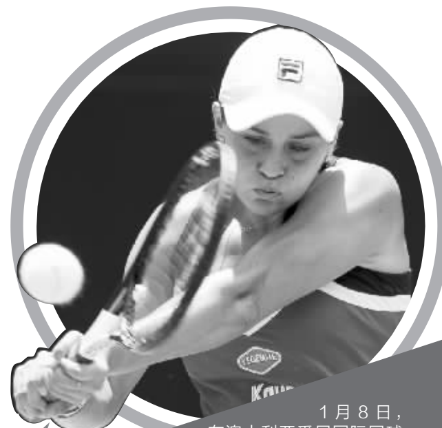
1月8日,在澳大利亚悉尼国际网球赛女单首轮比赛中,本土选手巴蒂以2比0战胜拉脱维亚选手奥斯塔彭科,顺利晋级。图为巴蒂在比赛中回球。

省会石家庄常年参与体育锻炼的100余名退休老干部、老同志参加了本次比赛,他们当中年龄最小的56岁,年龄最长的85岁。比赛分为男女两个组别,采取三局两胜制。经过3天的角逐之后,将于1月11日上午举行闭幕式和颁奖仪式。