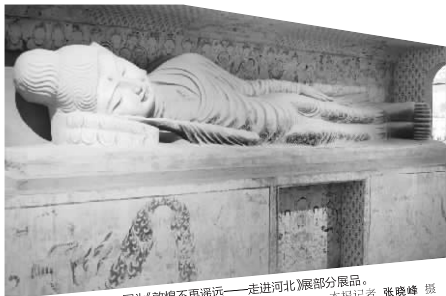
图为《敦煌不再遥远——走进河北》展部分展品。

本报讯(记者 张晓娟)千年之美,毕集于斯。1月9日下午,“敦煌不再遥远——走进河北”展览终于在河北博物院对媒体揭开了神秘面纱。高保真壁画精品、彩塑三维重建艺术复原等呈现方式让人们近距离感受到了敦煌文化的无穷魅力。敦煌研究院文物数字化研究所所长吴健介