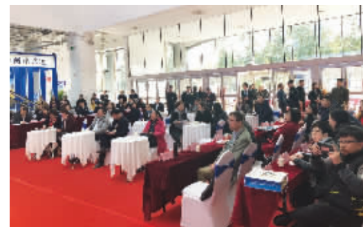
“4+4”对接沙龙吸引了很多企业金融单位参加

此次金博会“4+4”银企对接沙龙活动，让不少企业对项目融资充满信心。“以前总觉得从银行贷款很难，要求严，审批难，而我们小微企业又缺少抵押物。这次通过面对面接触，发现银行的融资产品很多，有的融资是不需要抵押物的，只要企业的各种资质、信用足够好，就可以拿到低成本的贷款。”一家小微企业的负责人说。企业负责人纷纷表示，希望政府部门多组织这样的银企对接活动，让大家了解更多的信息，解决融资中的实际问题。有的企业还建议，未来的银企对接活动最好再多些金融模式，比如把股权融资、债权融资等都纳入进来，企业的选择就更宽了。