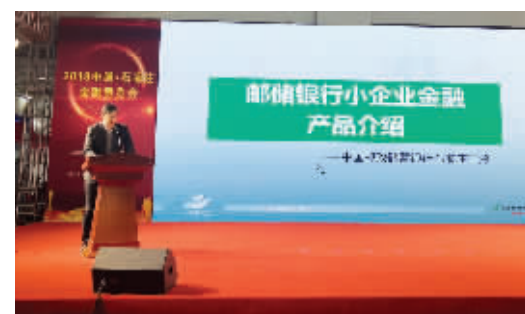
金融单位展示多样化融资产品